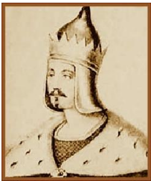
Изяслав в Киеве