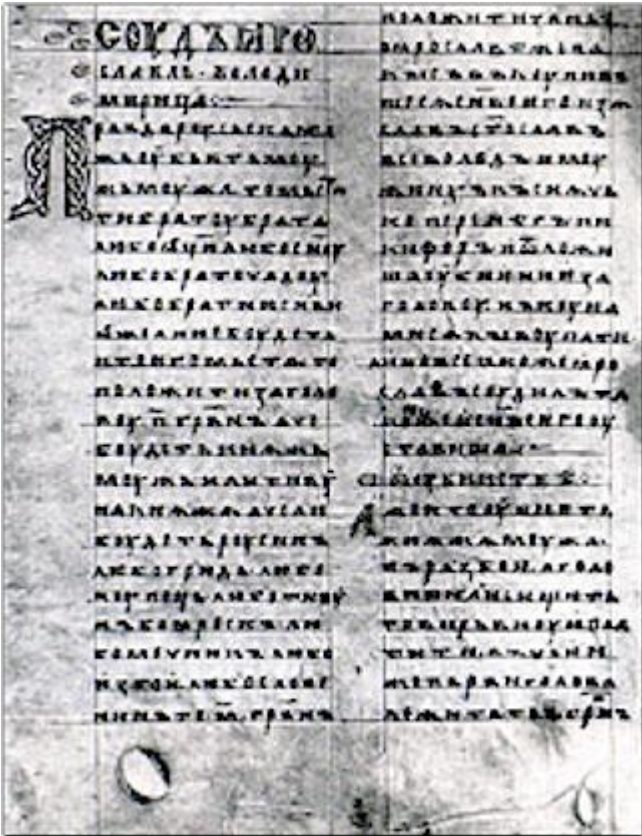
В р/т стр.28 №4.