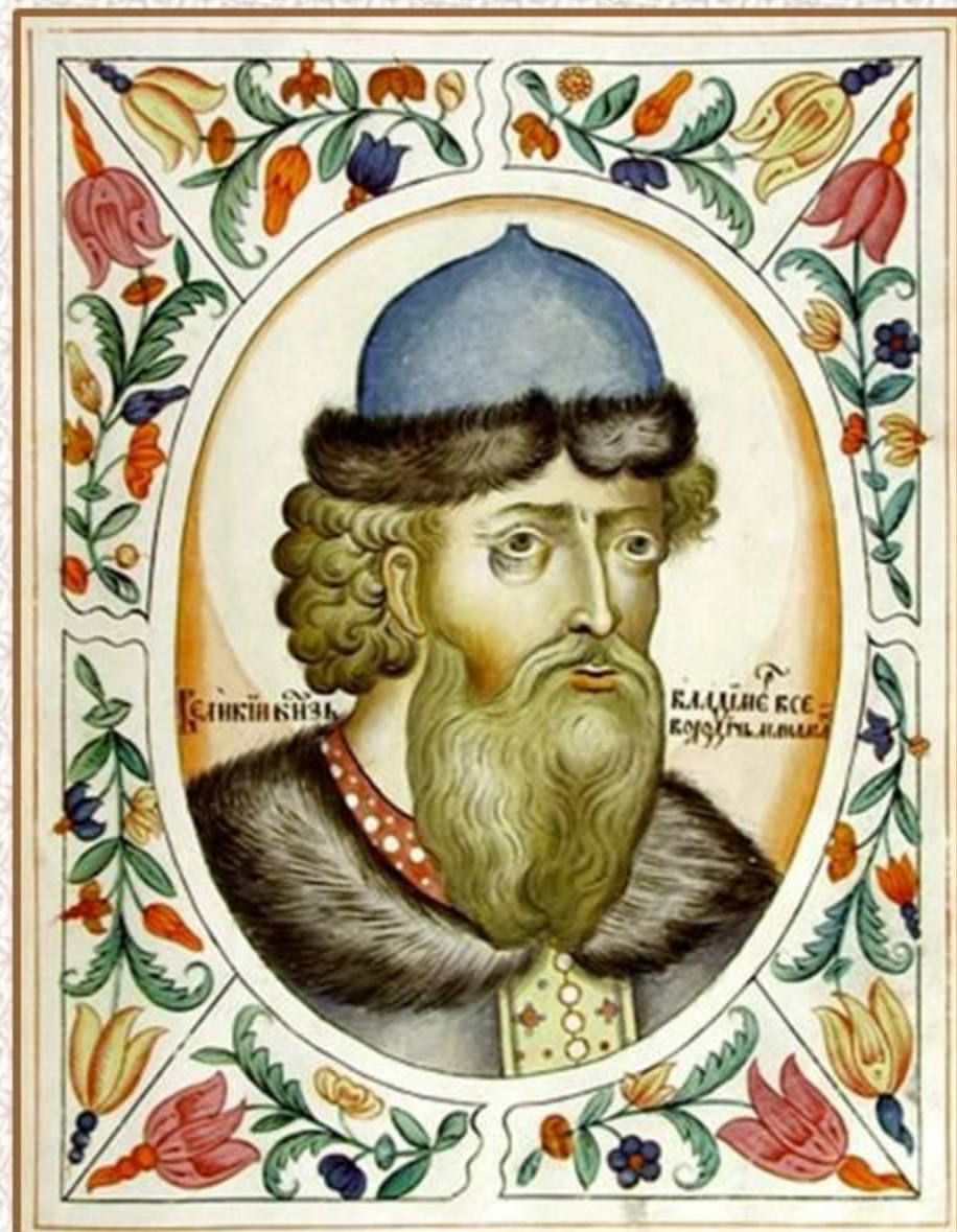
Великий князь Владимир Всеволодович Мономах. Портрет из Царского титулярника. 1672 год