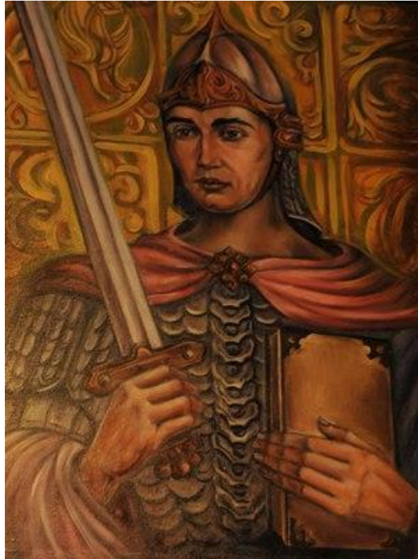
Святослав в Чернигове