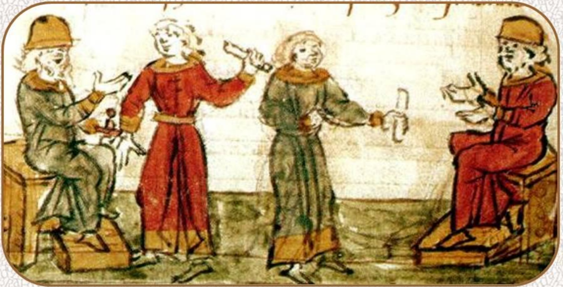
Распределение княжеских столов. Миниатюра Радзивилловской летописи

Князья договорились, кому какой вотчиной владеть, и целовали крест на том, что если кто заведет смуту, то идти на него всем князьям, всей землею.