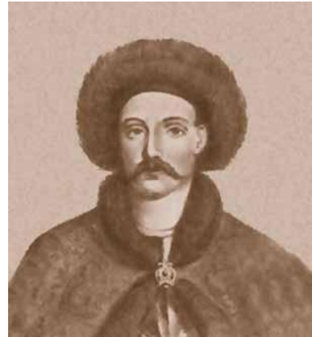
Всеволод в Переяславле