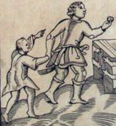
Торговля индульгенциями карикатура XVI в.