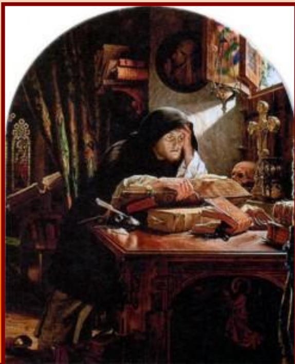
Мартин Лютер в Эрфурте

Мартин Лютер утверждал, что человек сам принимает решения, сам совершает поступки и сам несет за них ответственность.