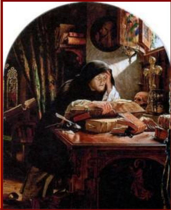
Мартин Лютер в Эрфурте

Мартин Лютер утверждал, что человек сам принимает решения, сам совершает поступки и сам несет за них ответственность.