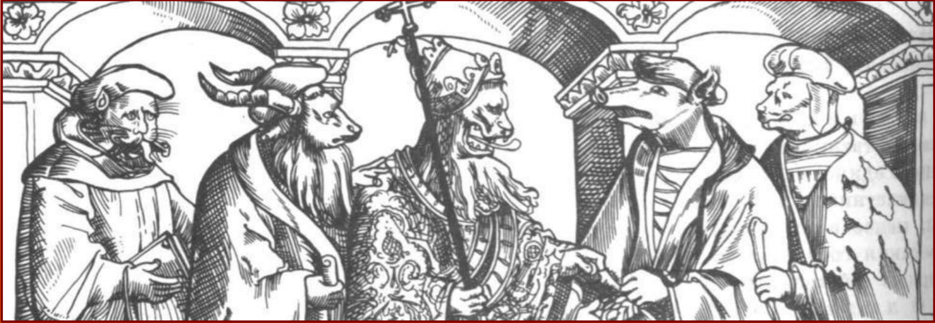
Папа и католические богословы. Карикатура 16 в.

Многие верующие совершившие паломничество в Рим были возмущены двуличием папы и кардиналов. Призывая народ к смирению, высшие руководители церкви вели роскошную жизнь, развлекались пирами и охотой, строили роскошные особняки себе и своим приближенным.