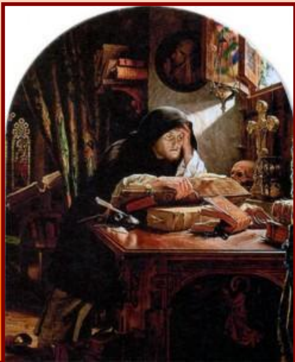
Мартин Лютер в Эрфурте

Мартин Лютер утверждал, что человек сам принимает решения, сам совершает поступки и сам несет за них ответственность.