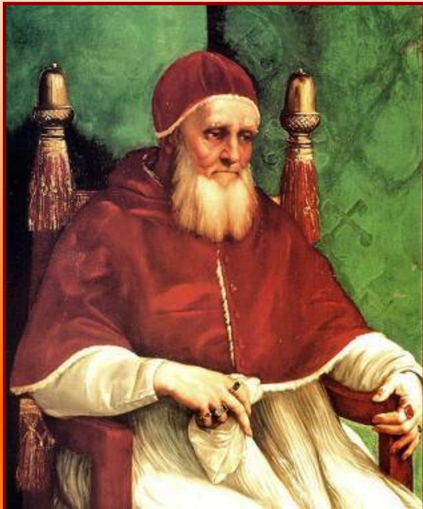
Папа Юлий II

Высшее руководство католической церкви, призывая народ жить в смирении и скромности, быть сдержанными в желаниях и стремлениях, соблюдать заповеди, само жили в роскоши: имело дворцы, проводило балы и пиры, оказывало покровительство родственникам.