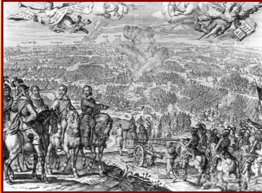
Религиозная война в Германии

Сторонники Лютера заявили императору протест, их стали называть протестантами . В Германии начались войны между католиками и протестантами. Боясь потерять власть, Карл V в 1555 г. в Аугсбурге заключил мир с протестантскими князьями. Устанавливалось равенство католиков и протестантов, князья получили право устанавливать религию на своих землях.