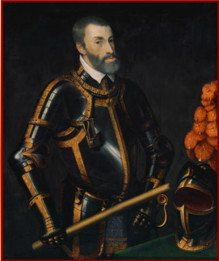
Император Карл V

После разгрома крестьянского восстания началась княжеская Реформация. Князья захватывали монастырские земли. Некоторые духовные князья отказывались от сана и становились светскими правителями. Но многие князья, боясь новых восстаний, остались верны католицизму. В 1529 г. император Карл V запретил лютеранство и присвоение церковного и монастырского имущества.