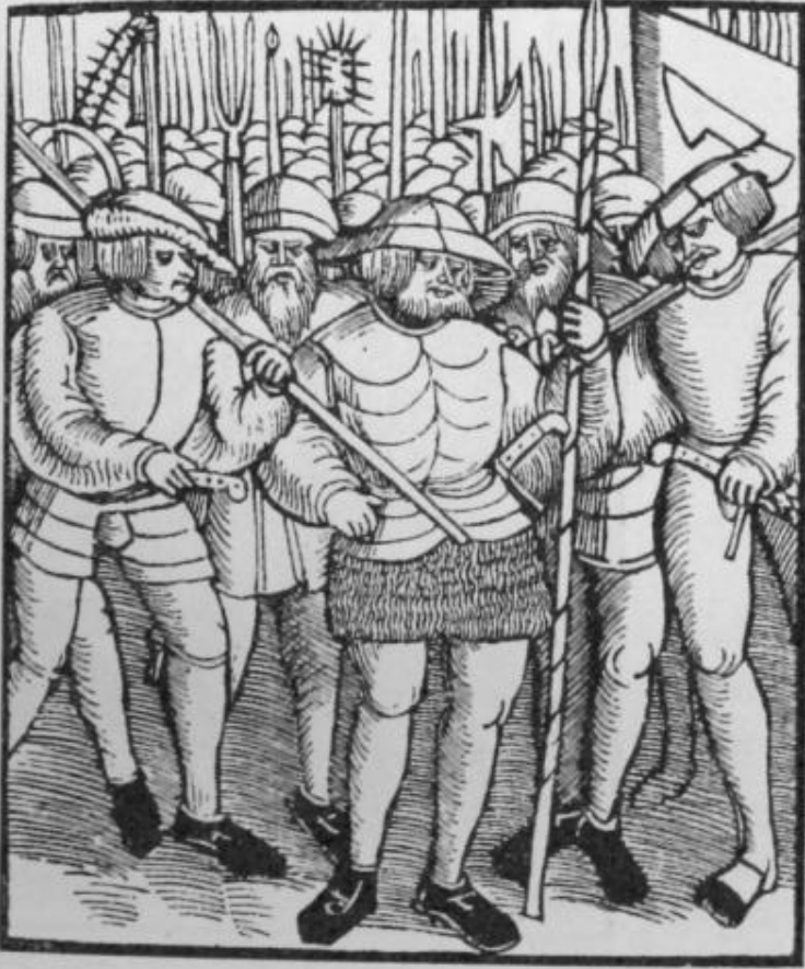
Титульный лист "Двенадцати статей"

Handlung/Artickel vnnnd Instruction / so fürgend men worden sein vnn allen Rottenn vnnnd hauffen der Pauren / so sich besamen verpflicht haben: M: D: xxv: