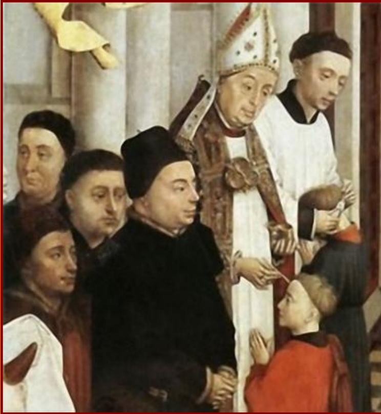
Обряд миропомазания в священники

В эпоху Возрождения мир стремительно менялся, а католическая церковь оставалась прежней. Новые научные открытия вступали в противоречие с религиозными догмами.