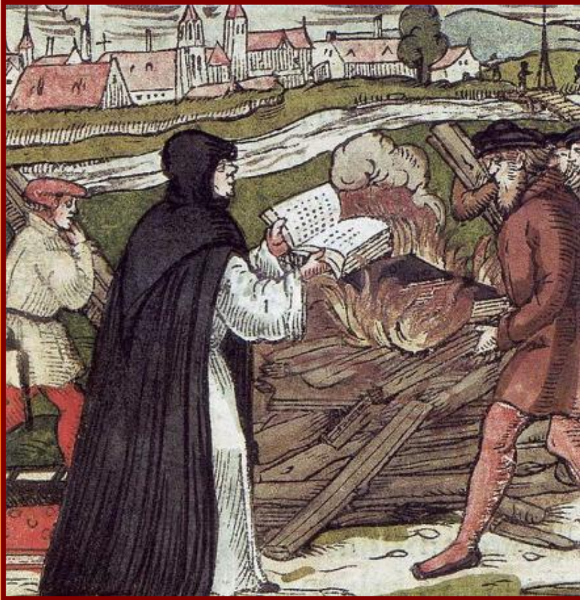
Мартин Лютер сжигает папскую буллу (гравюра на дереве 1557 г.)

31 октября 1517 г. Лютер прикрепил к дверям церкви 95 тезисов против индульгенций, в которых излагались его взгляды на реформу католической церкви.