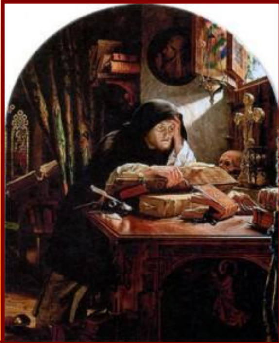
Мартин Лютер в Эрфурте

Мартин Лютер утверждал, что человек сам принимает решения, сам совершает поступки и сам несет за них ответственность.