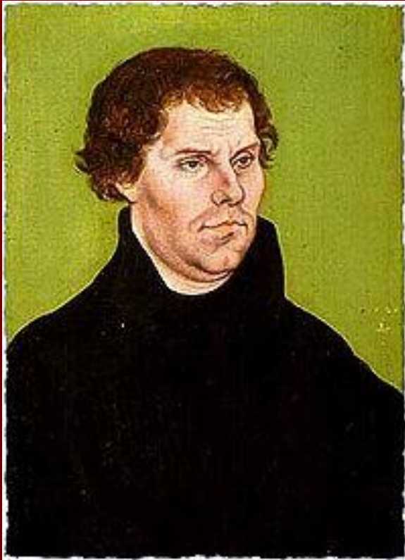
Портрет 1526 г. Худ. Л.Кранах Ст.