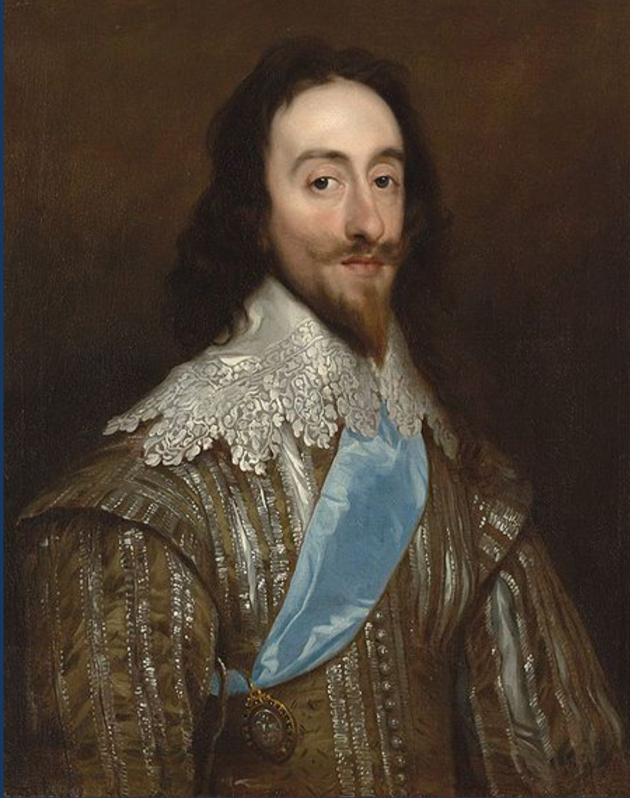
Карл Первый, портрет Дэниэла Майтенса.

1640г. – созыв Долгого парламента, начало революции.