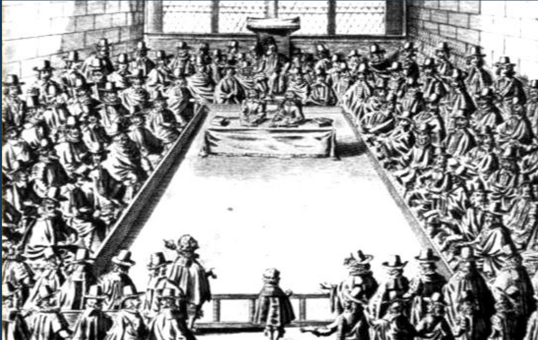
Заседание Долгого парламента. Гравюра XVII в.

Реформы Долгого парламента были направлены против абсолютизма, власть короля ограничивалась законом и парламентом.