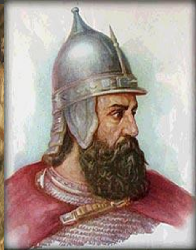
Дмитрий I Иванович Донской