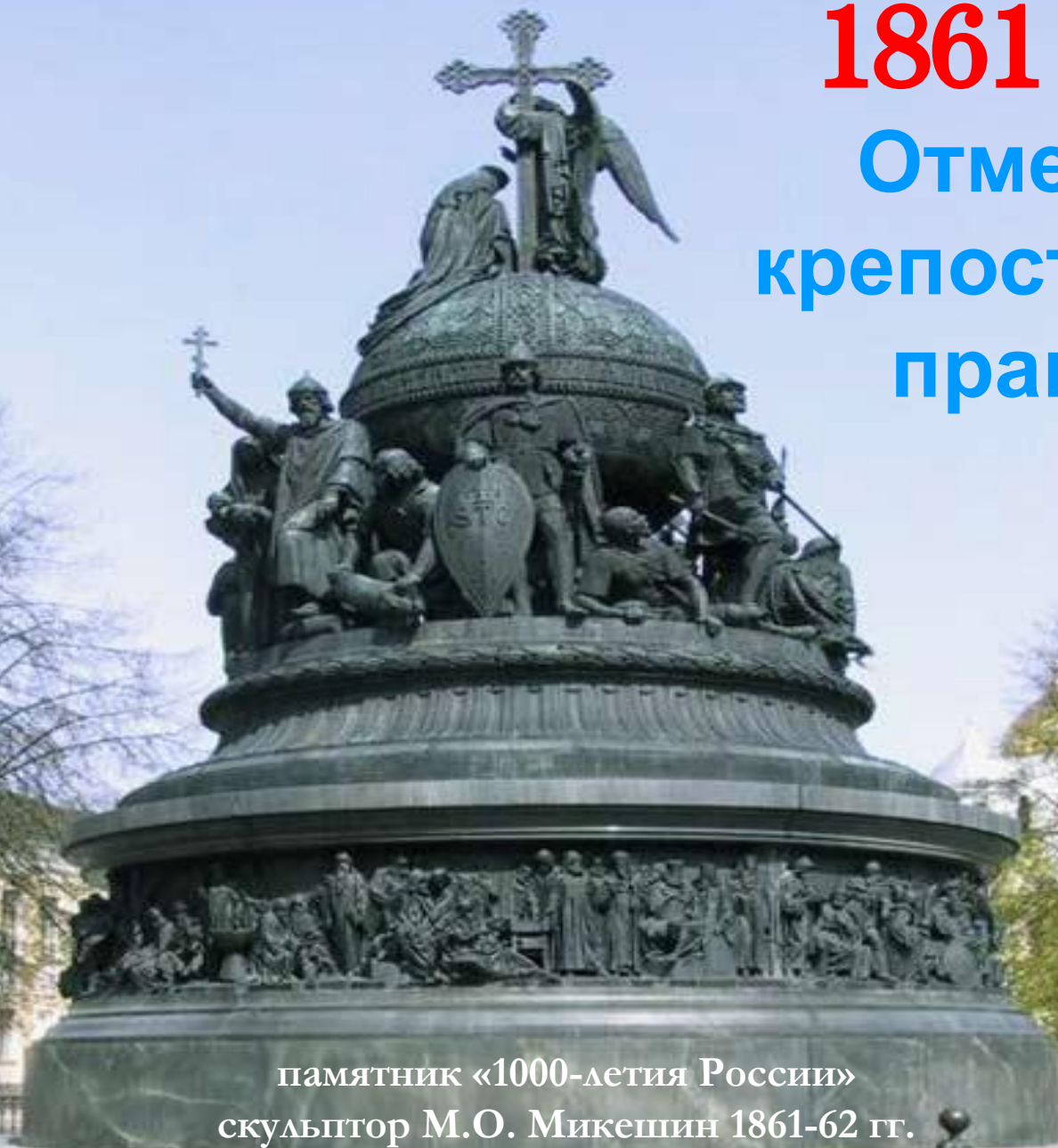
памятник «1000-летия России» скульптор М.О. Микешин 1861-62 гг.