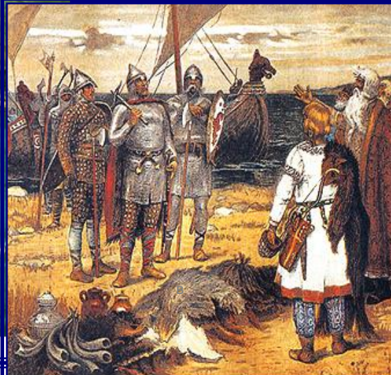
А.М. Васнецов. "Варяги"