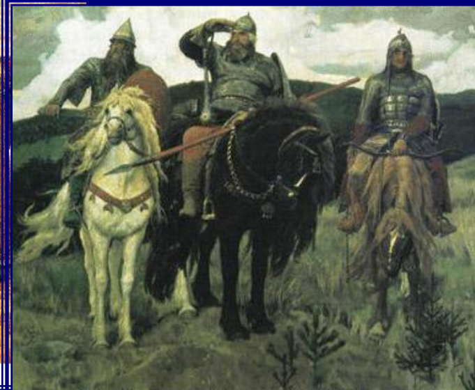
В.М. Васнецов. "Богатыри". 1881-98 гг.