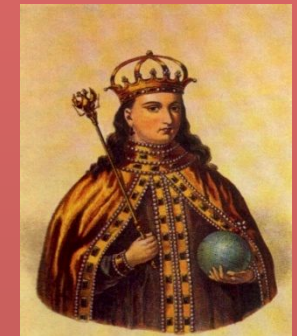
Двойной трон - Иван и Петр регентша