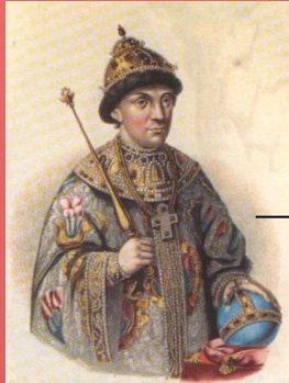
Отец Петра I Алексей Михайлович