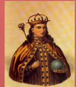
Двойной трон - Иван и Петр регентша