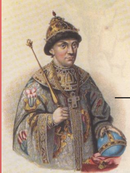
Отец Петра I Алексей Михайлович