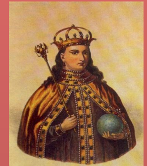
Двойной трон - Иван и Петр регентша