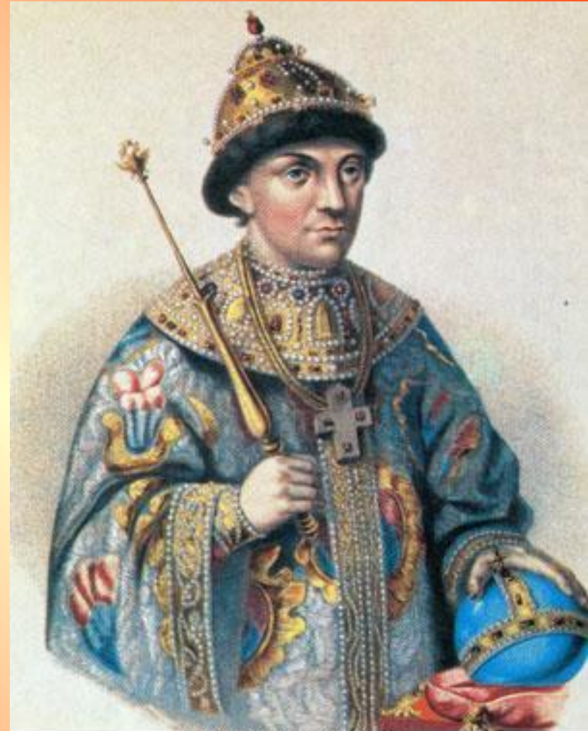
Федор Алексеевич (1661-1682)