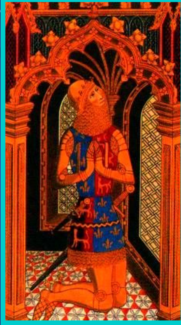
«Черный принц» Эдуард.

Французы имели двое- кратный перевес. Ан- глийский командующий - принц Эдуард (Черный рыцарь) хотел оставить добычу, лишь бы его войско пропустили на юг.