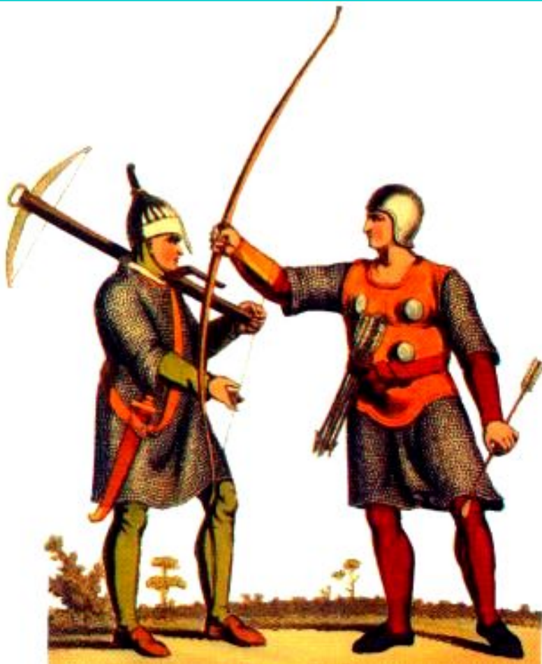
Большой лук-вооружение английских воинов.

Во время Столетней войны произошли революционные изменения в военном деле. На смену холодному оружию пришло огнестрельное.