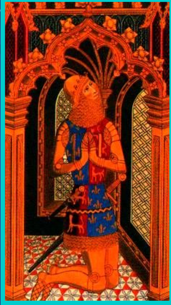
«Черный принц» Эдуард.

Французы имели двое- кратный перевес. Ан- глийский командующий - принц Эдуард (Черный рыцарь) хотел оставить добычу, лишь бы его войско пропустили на юг.