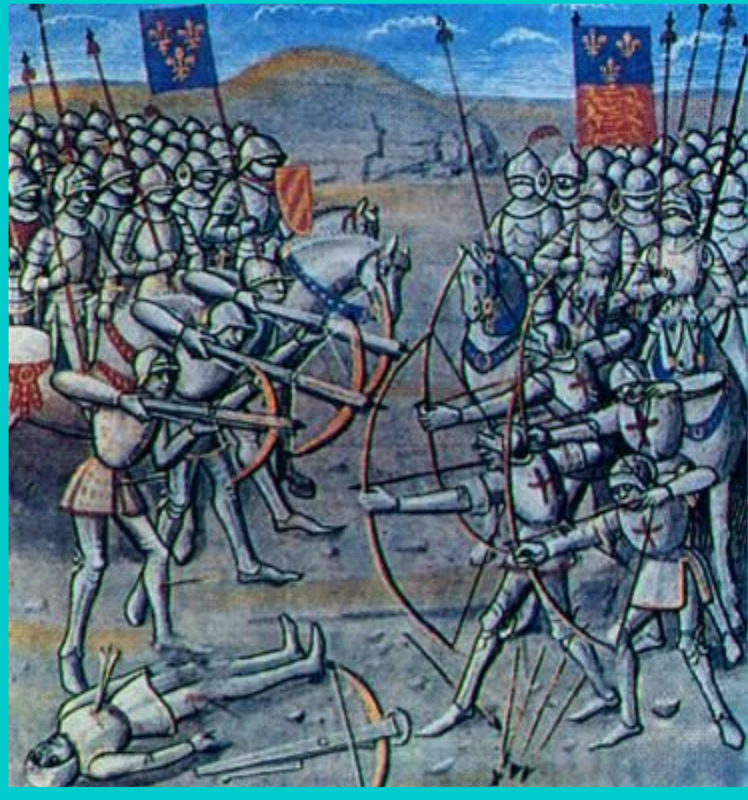
Битва при Кресси. Средневековая миниатюра.

В 1340 г. в морском сражении при Слейсе флот Франции был разбит . Несколько лет спустя боевые действия возобновились. В 1346 г. у Кресси французы потеряв 12 тыс. человек потерпели поражение. Англичане захватив огромную добычу, начали наступление в глубь страны.