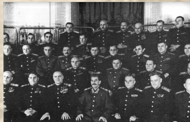
Соображения по плану стратегического развертывания сил Советского Союза на случай войны с Германией