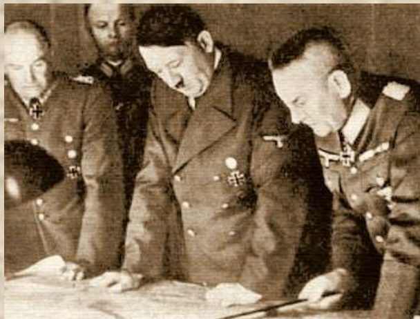
Директива № 21 План «Барбаросса»