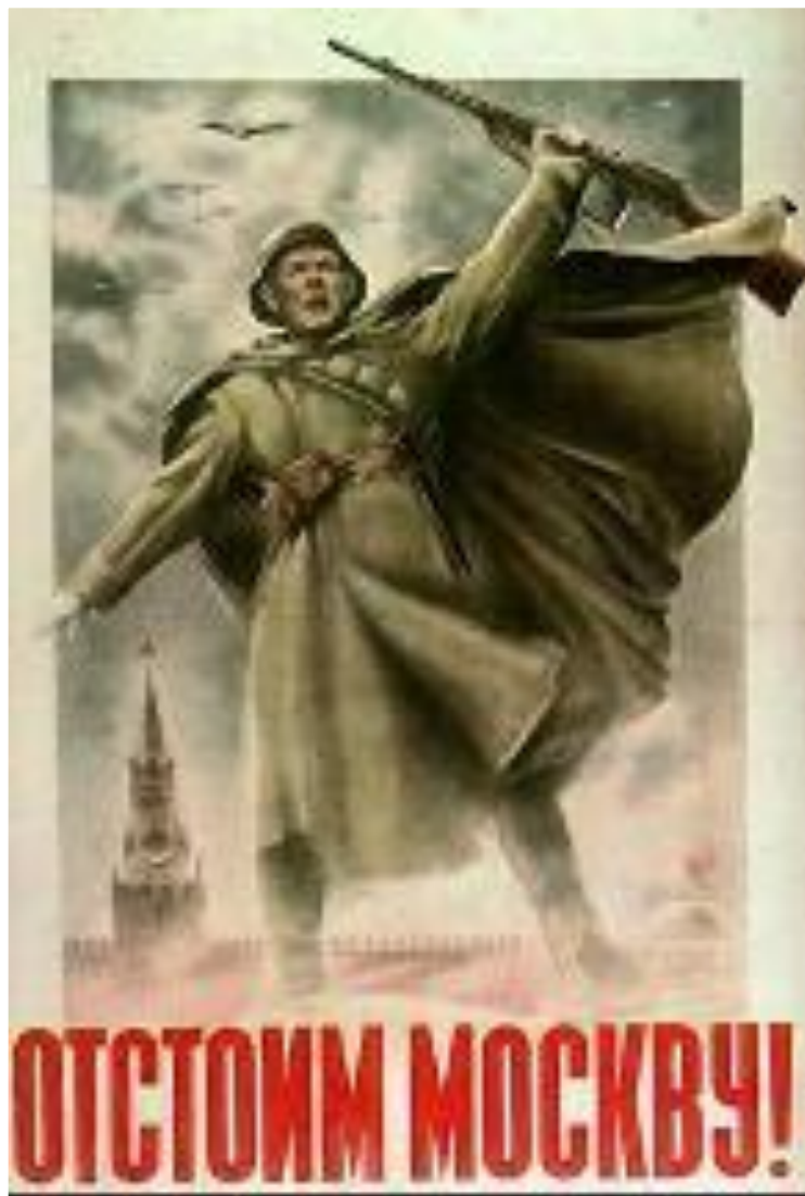
Плакат 1941 г.

Для захвата Москвы был подготовлен план «Тайфун». Немцы попытались достичь на этом направлении 3-кратного превосходства в живой силе и технике. 30 сентября началось генеральное наступление. Под Вязьмой и Брянском советские войска попали в окружение, но сковали действия врага. Оборону Москвы возглавил Г. Жуков. В ноябре враг подошел к городу и в Москве было объявлено осадное положение.