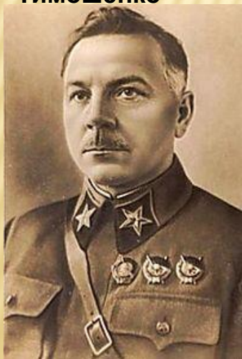
Климент Ефремович Ворошилов

Первые заседания Ставки Главного Командования Вооружённых сил в июне проходили без Сталина. Председательство наркома обороны СССР маршала С. К. Тимошенко было лишь номинальным.