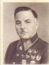
К. Е. ВОРОШИЛОВ