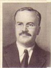
В. М. МОЛОТОВ