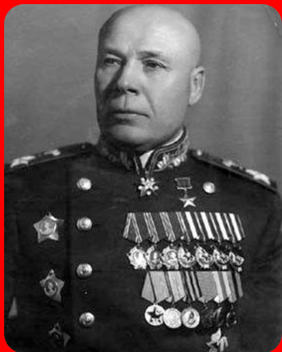
Семён Константинович Тимошенко