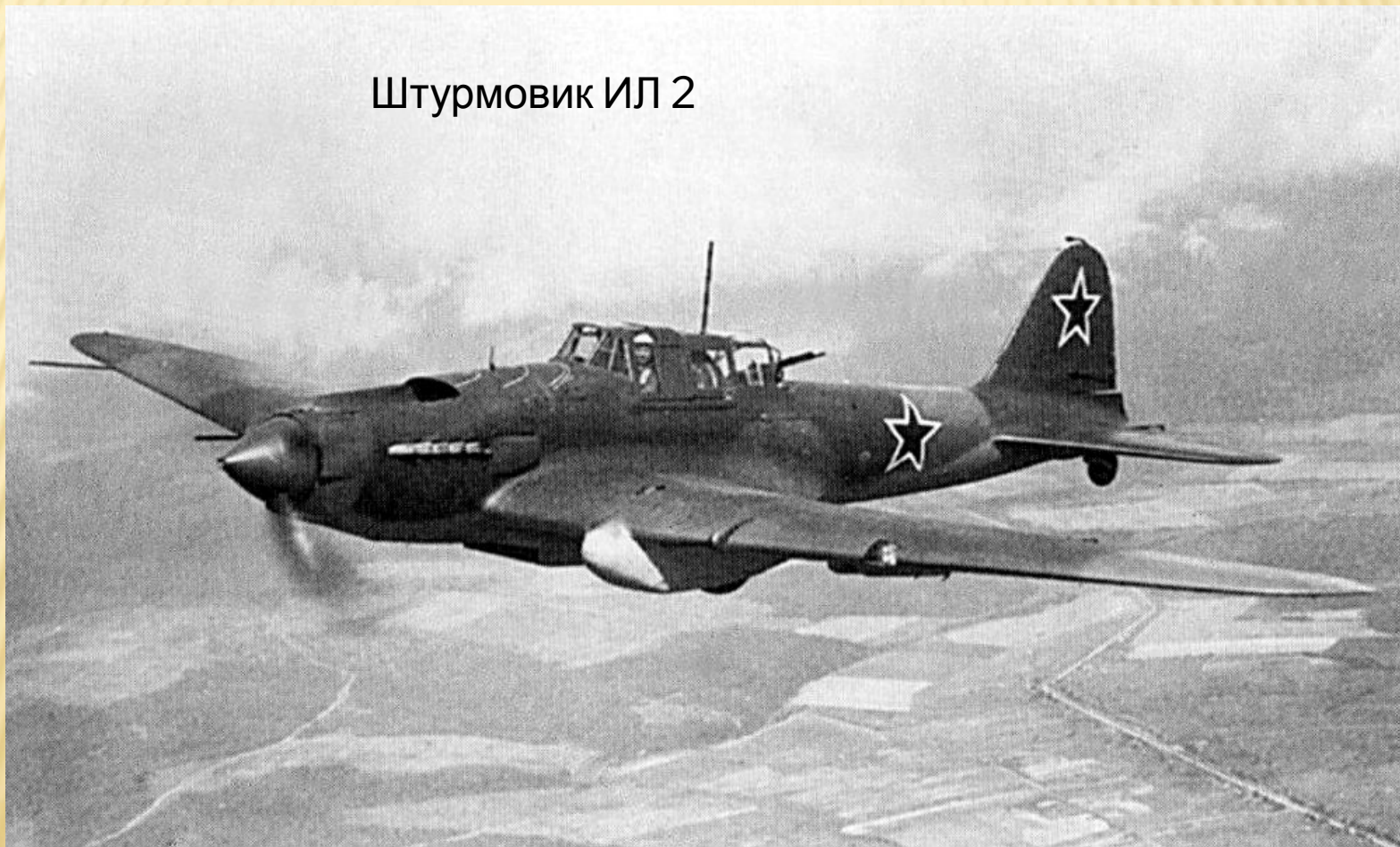
Штурмовик ИЛ 2