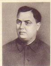
Г. М. МАЛЕНКОВ