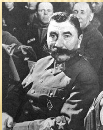
Семён Михайлович Будённый

Первые заседания Ставки Главного Командования Вооружённых сил в июне проходили без Сталина. Председательство наркома обороны СССР маршала С. К. Тимошенко было лишь номинальным.