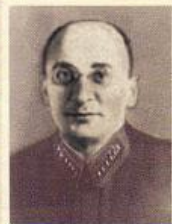
Л. П. БЕРИЯ