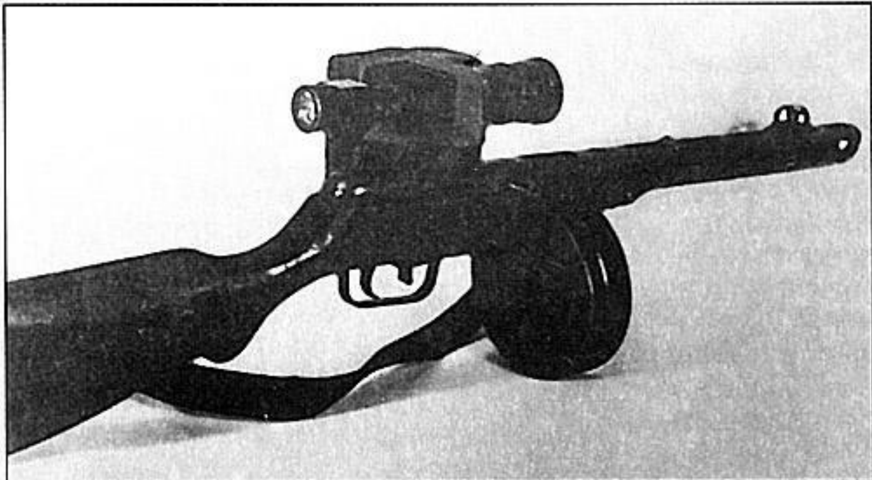
Автомат ППШ с ночным прицелом (1943 г.).