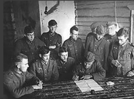
Немецкие солдаты на Западном фронте. Осень 1939 года.

Англо-французские и сосредоточенные против них германские войска бездействовали. Правительства Великобритании и Франции рассчитывали на примирение с Германией, а немецкая армия готовилась к наступлению против стран Зап. Европы.