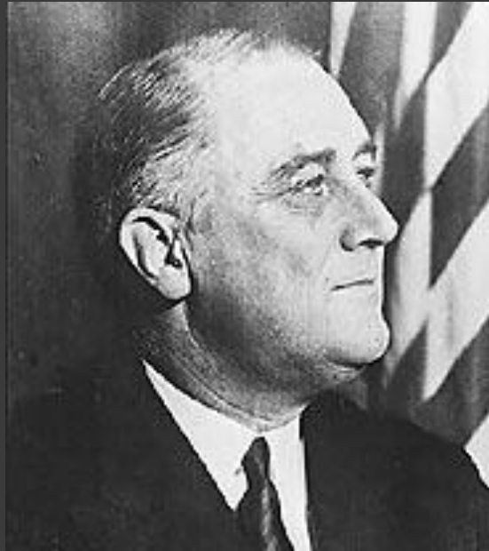
Президент США Франклин Рузвельт