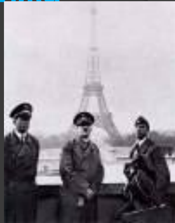
А.Гитлер с соратниками в Париже 1940 год