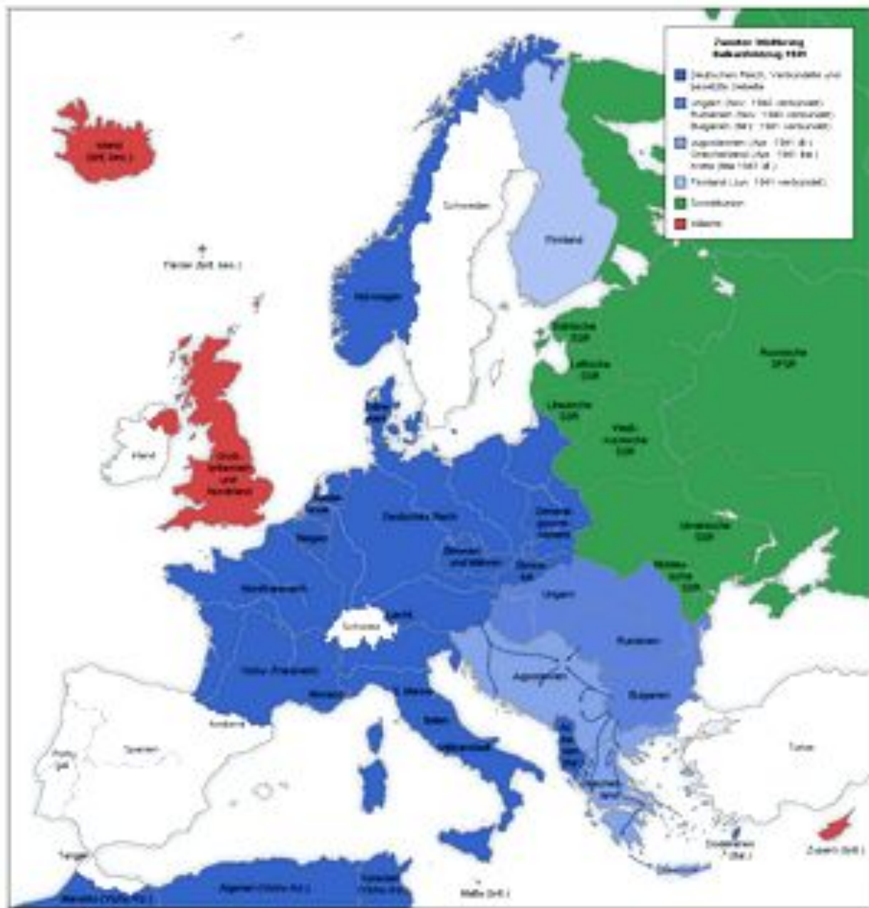
Карта Европы к июню 1941 года

Синий цвет - Германия, союзники, протектораты. Розовый - Англия. Зелёный - СССР