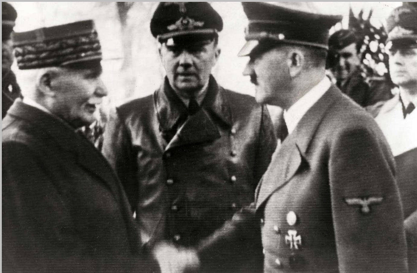
Маршал Петен после подписания капитуляции Франции

Но добивать их немецкие войска не стали и англичане смогли эвакуироваться. Тем не менее положение французской армии было тяжелым - единый фронт распался.