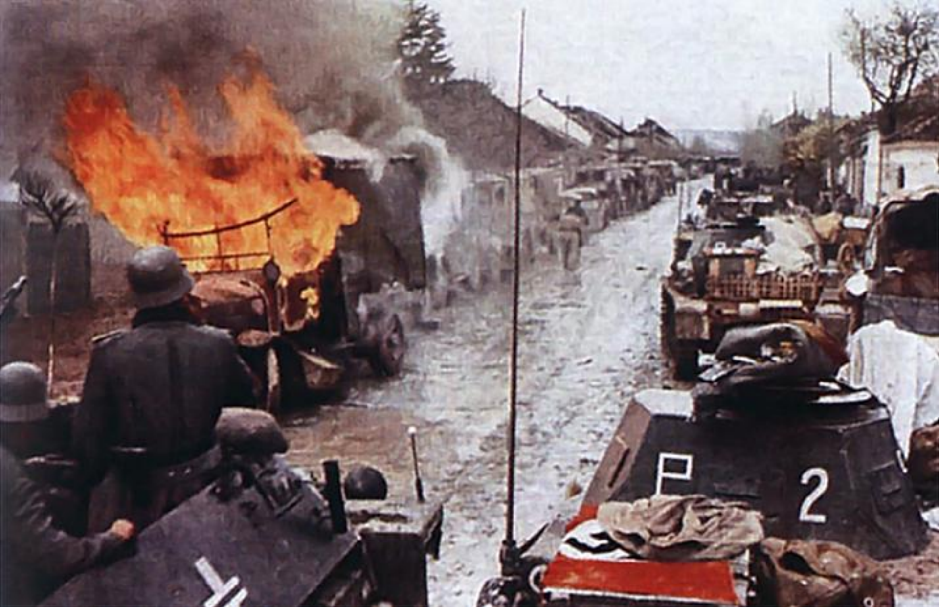
Вторжение немецкой армии в Югославию в апреле 1941 г.