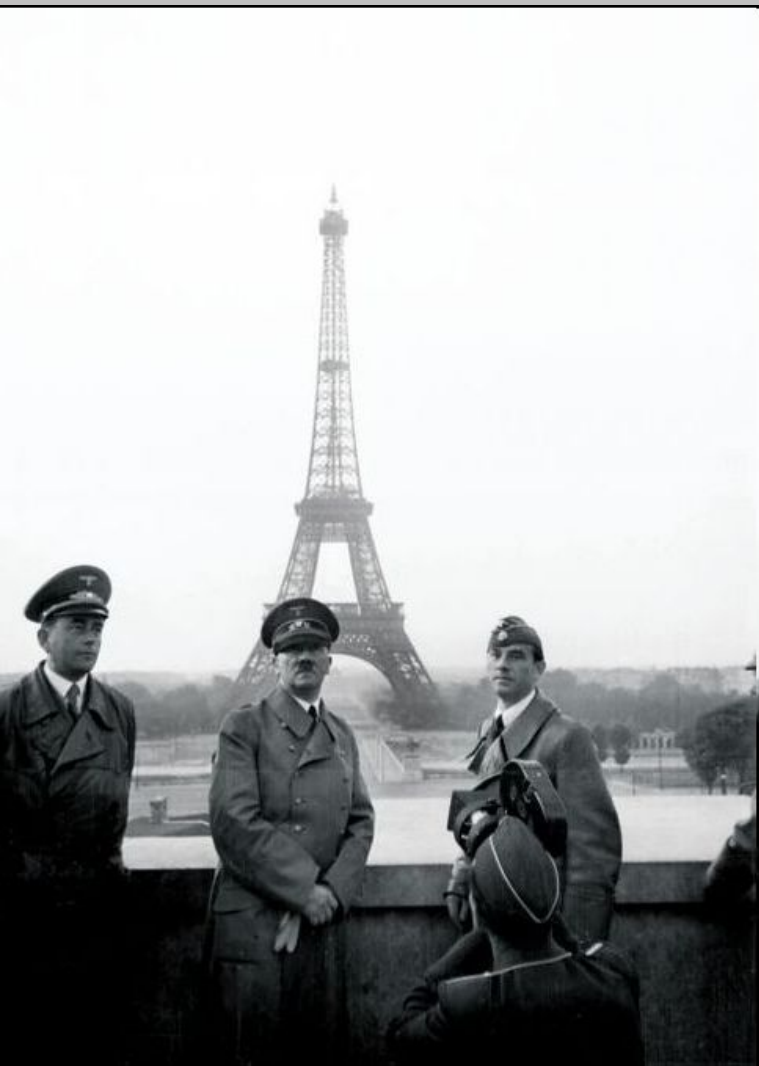
Гитлер в Париже, 23 июня 1940г.