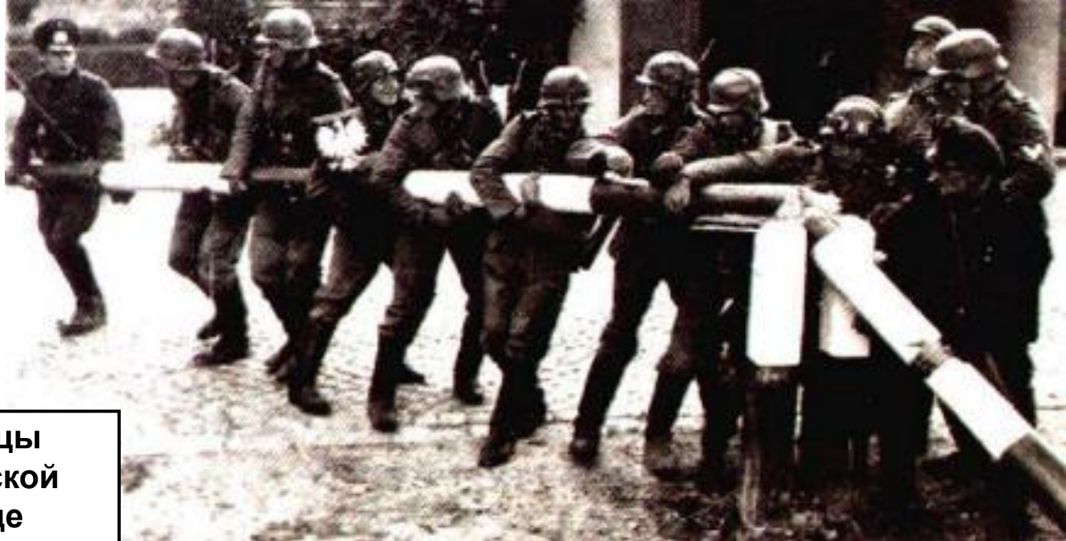
Эсесовцы на польской границе

Гитлер бросил Против Польши 2/3 вооруженных сил, техническое и численное превосходств которых было абсолютным. Польская авиация была уничтожена за 2 дня. 16 сентября немцы подошли к Варшаве.