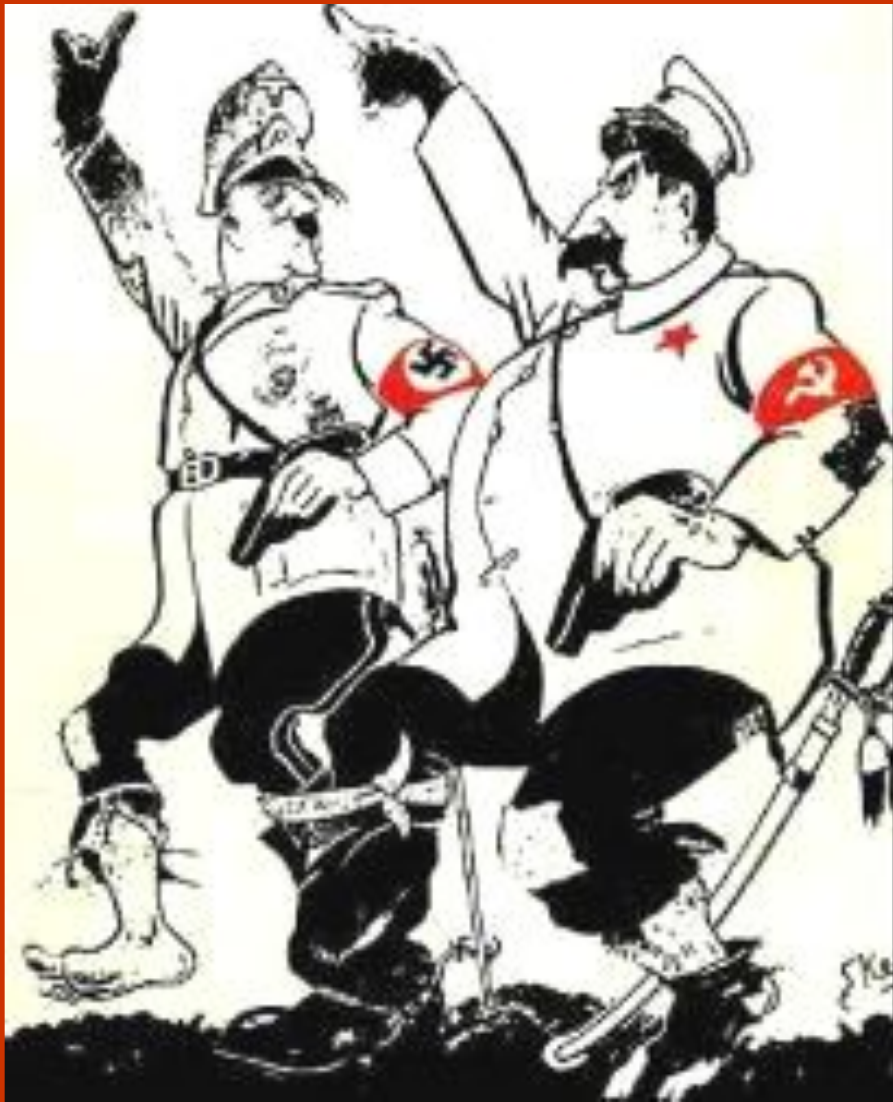
Английская карикатура на Гитлера и Сталина

Польское государство ликвидировалось. Западная Украина и Западная Белоруссия отошли к СССР, а польские земли, граничившие с Германией, были объявлены немецким генерал- губернаторством, управляемым из Берлина.