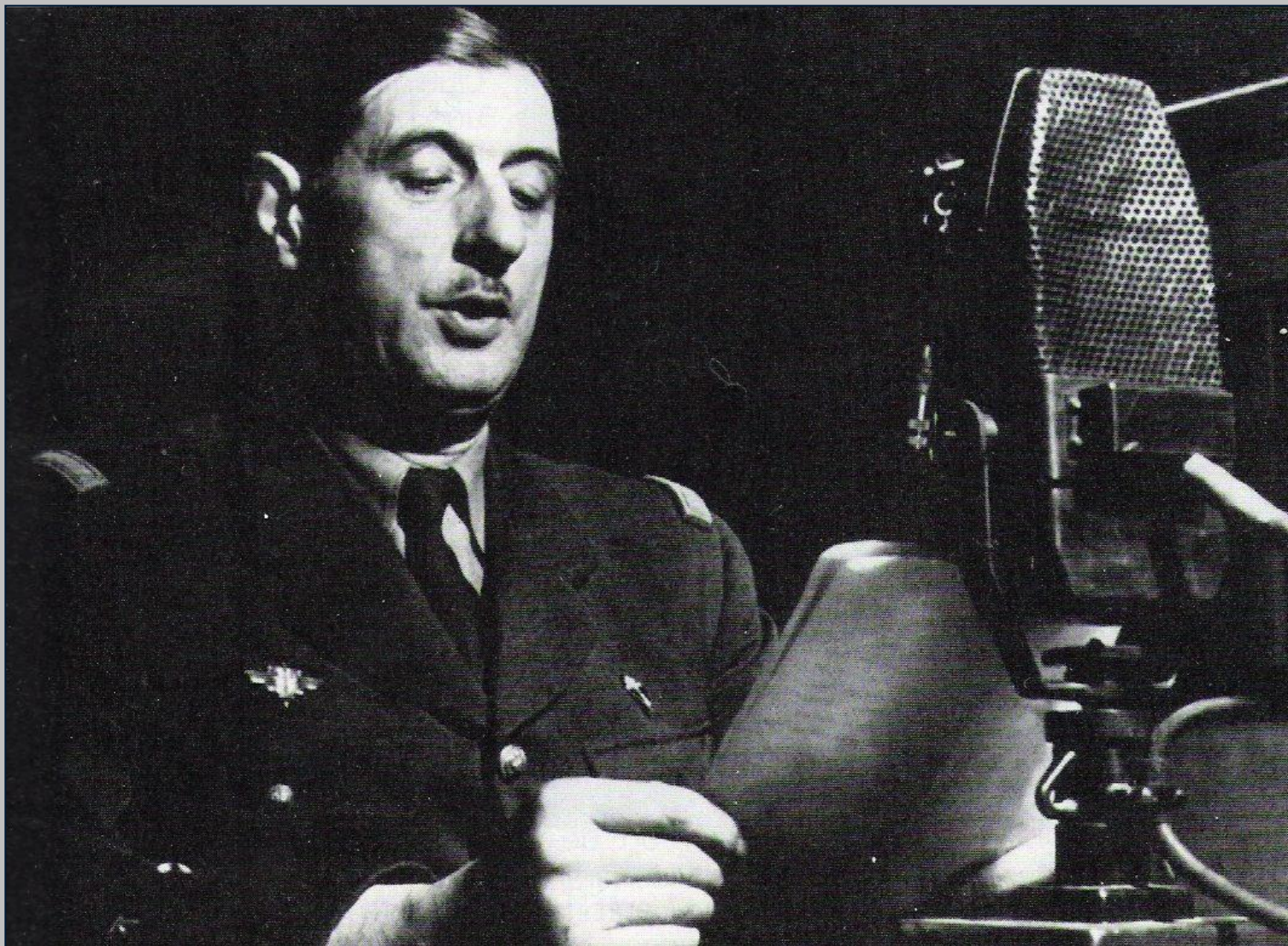
Генерал Шарль де Голль выступает с обращением к французам. Он призвал вступить в ряды «Свободной Франции».