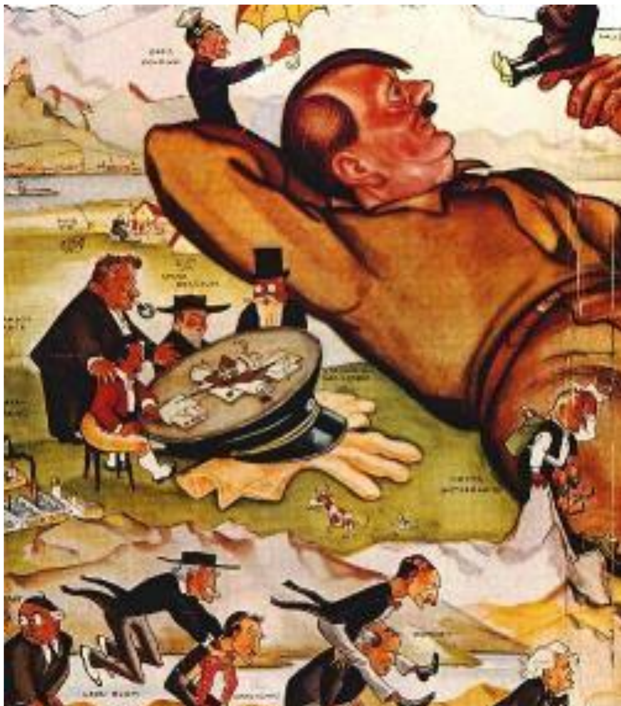
Европа «ублажает» Гитлера.