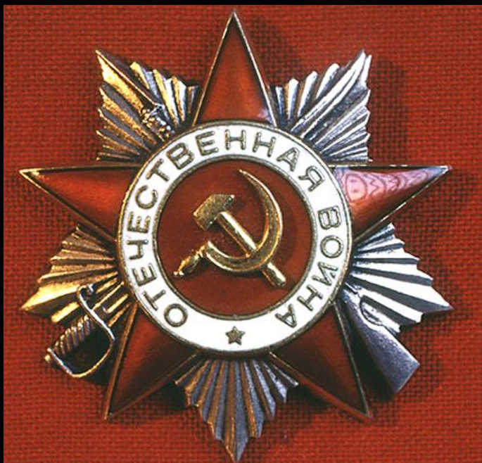
Орден 1-й степени