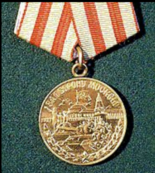
Медаль «За оборону Москвы»