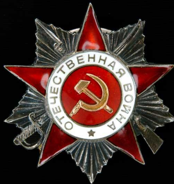
Орден 2-й степени

20 мая 1942 года был учреждён орден Отечественной войны 1-й и 2-й степени. Это была первая награда, появившаяся в годы войны. Этим орденом награждали и военных, и гражданских, которые отличились в борьбе с фашистами.