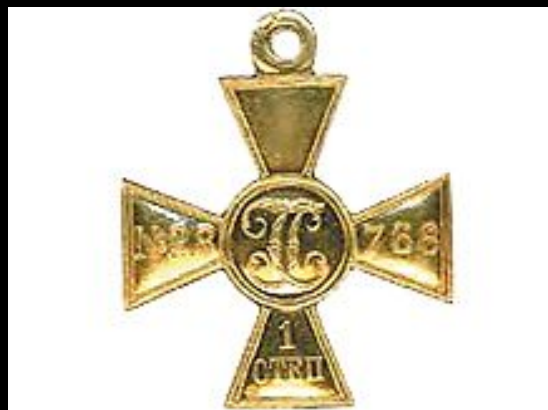
Георгиевский крест 1-й степени