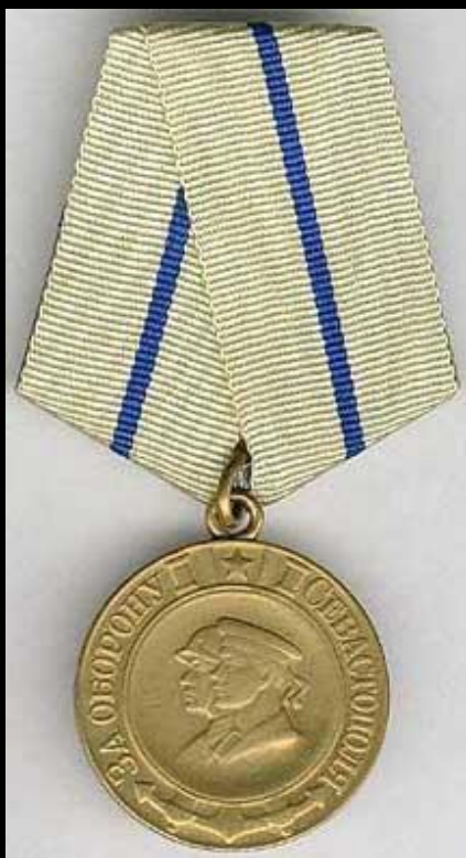
Медаль «За оборону Севастополя»