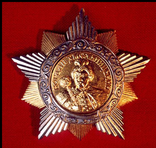
Орден Богдана Хмельниц кого