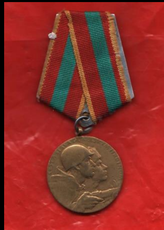
Медаль «За освобождение Будапешта»