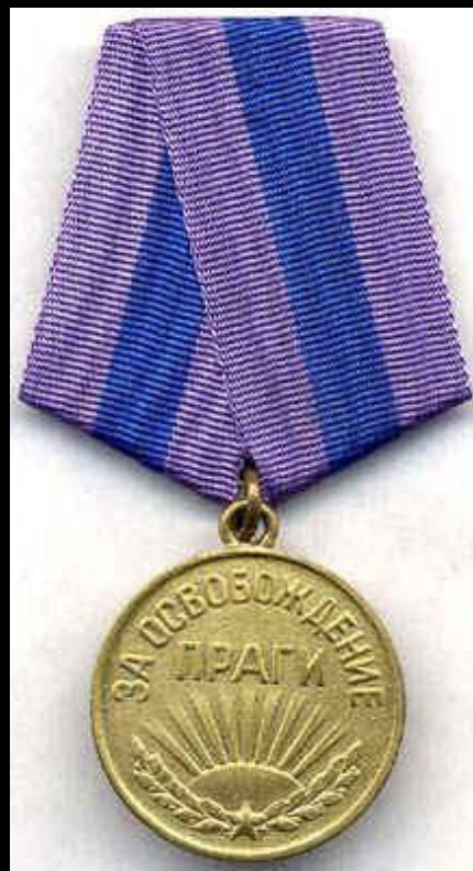
Медаль «За освобождение Праги»