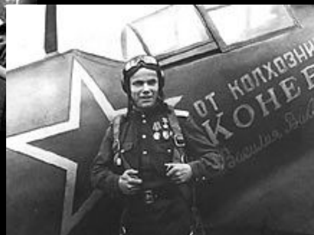
И. Кожедуб в годы войны

Трижды герои Советского Союза – лётчики Александр Покрышкин и Иван Кожедуб.