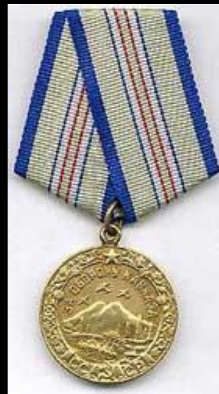
Медаль «За освобождение Кавказа»