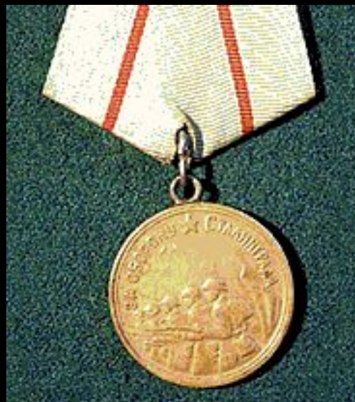
Медаль «За оборону Сталинграда»

В годы войны были учреждены медали за оборону городов-героев. Медаль «За оборону Москвы» учреждена 1 мая 1944 года. Ею награждали, как военнослужащих, так и гражданских лиц. Всего этой медалью наградили более миллиона человек. Медаль «За оборону Сталинграда» учреждена 22 декабря 1942 года. Всего ею награждено 760 тысяч человек.