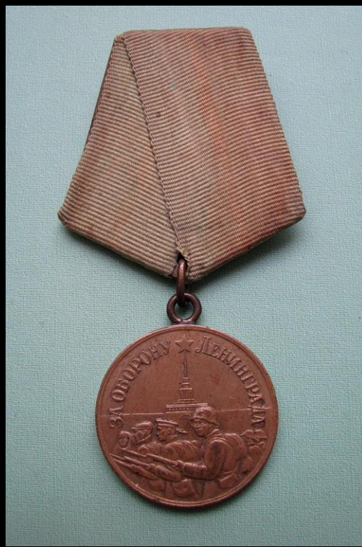
Медаль «За оборону Ленинграда»