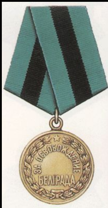
Медаль «За освобождение Белграда»