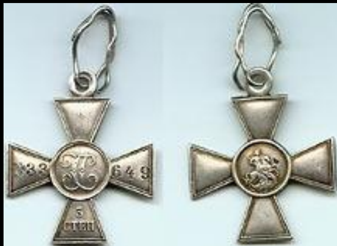
Георгиевский крест 2-й степени

Орден славы напоминает старинный русский солдатский орден – Георгиевский крест. Об этом сходстве напоминает знаменитая чёрно-оранжевая ленточка, которая получила название Георгиевской.