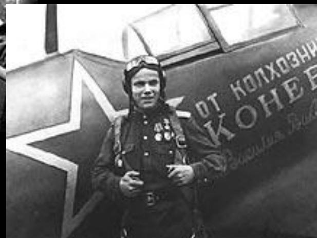
И. Кожедуб в годы войны

Трижды герои Советского Союза – лётчики Александр Покрышкин и Иван Кожедуб.