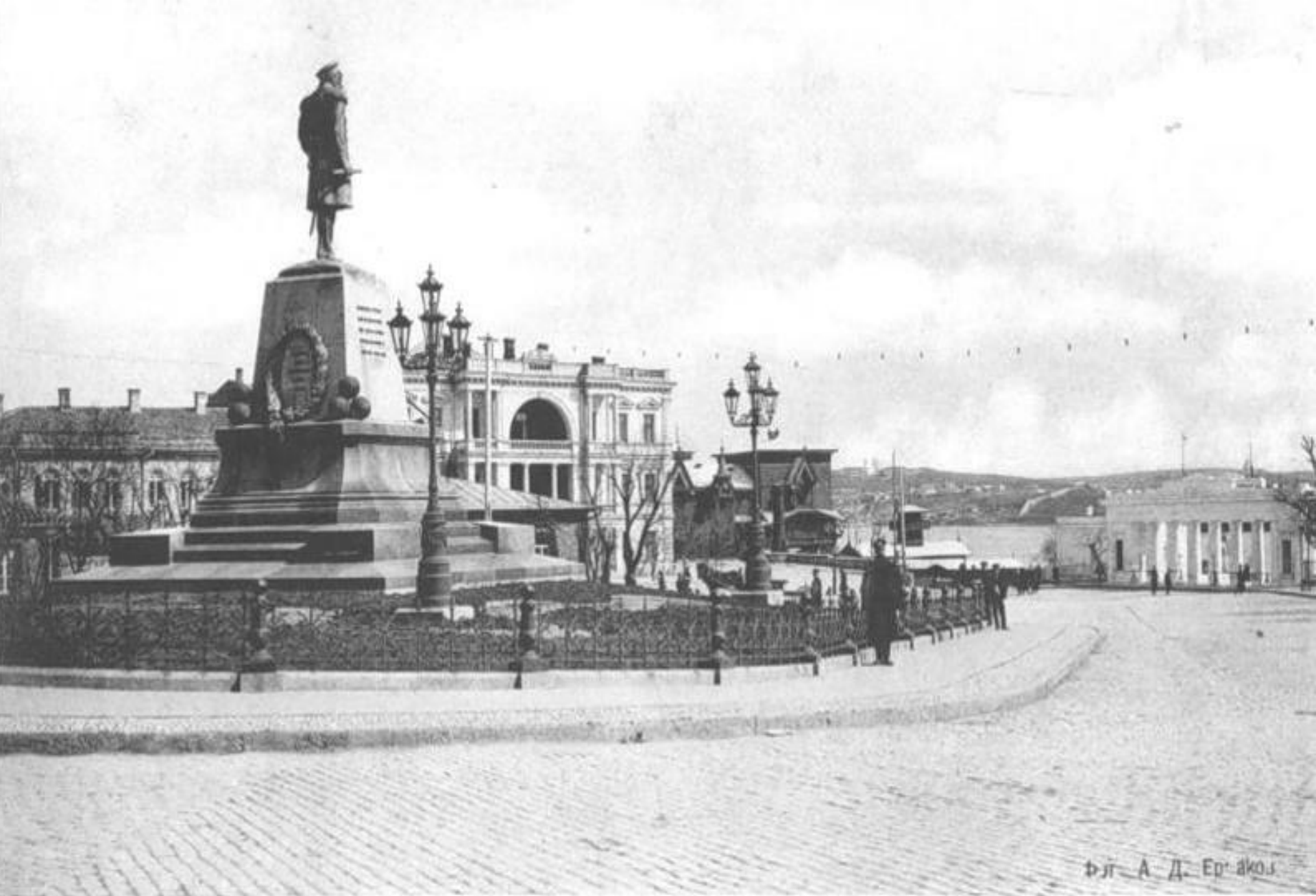
Памятник Нахимову. Город Севастополь