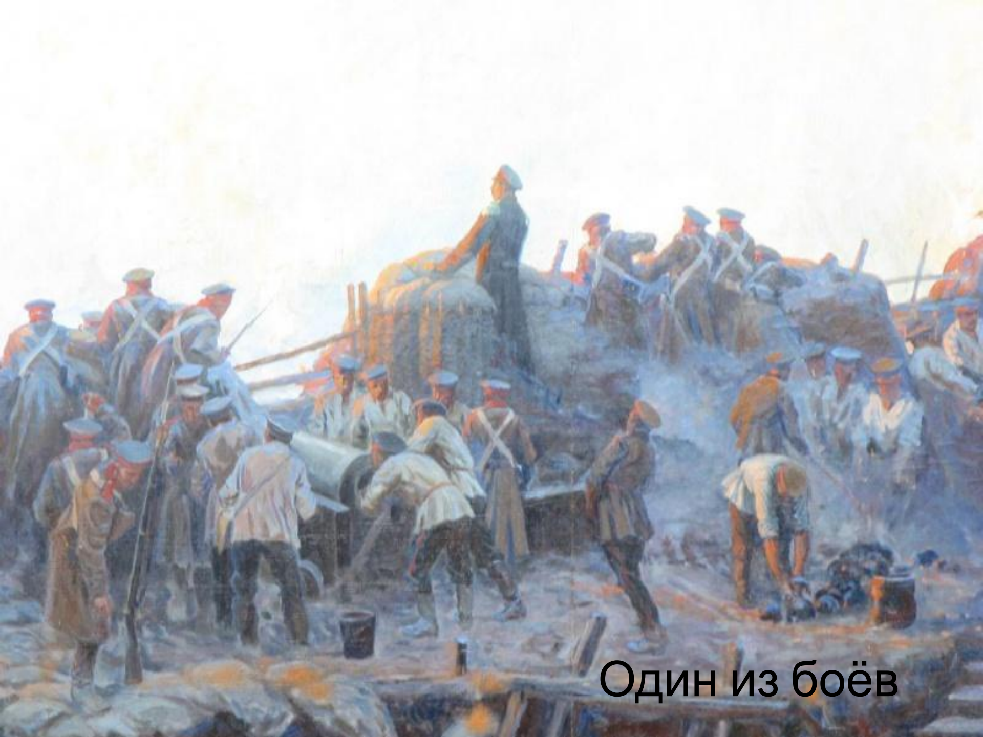
Один из боёв