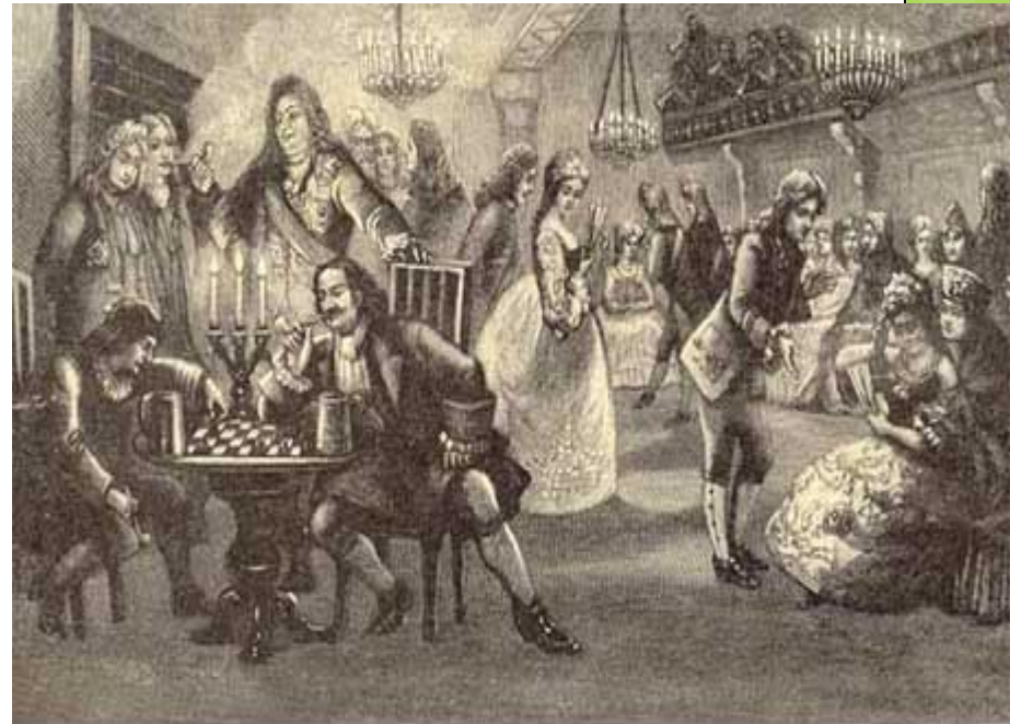
Ассамблея при Петре I.