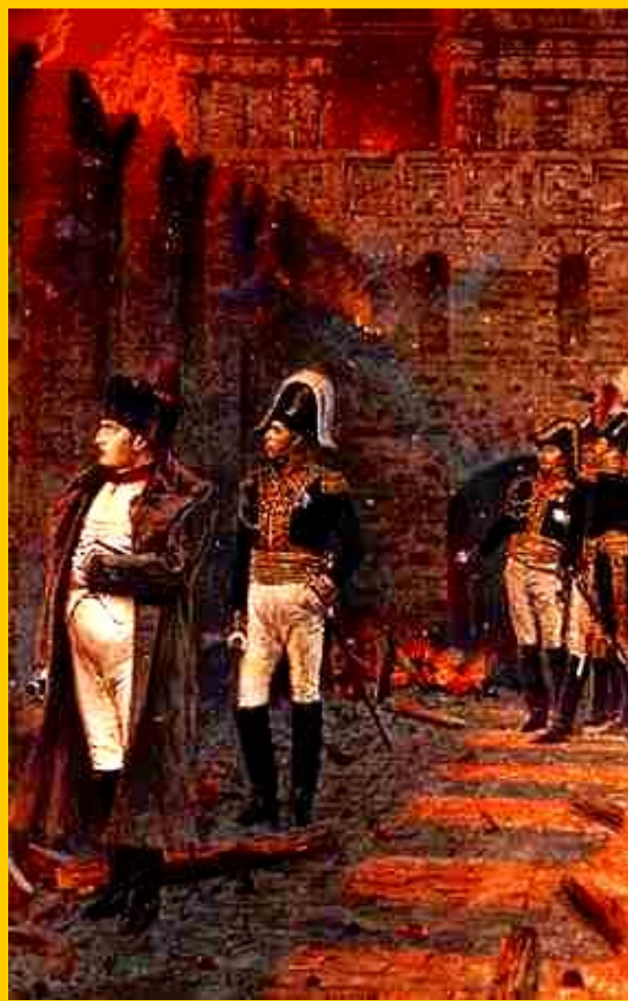
Пожар в Кремле

Русская армия перекрыла все дороги на юг. Лишившись связи с Францией, Наполеон месяц спустя оставил Москву, но попытка прорваться на юг провалилась. Французы двинулись на Запад по разоренной Смоленской дороге.