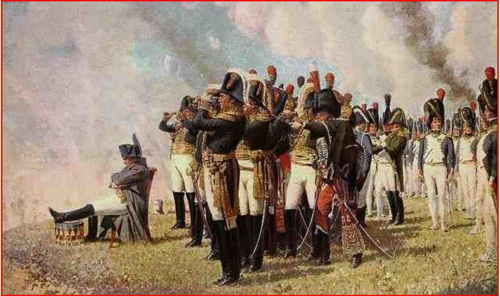
Наполеон на Бородинском поле

7 сентября 1812 г. в 120 км. от Москвы у дер.Бородино произошло генеральное сражение. После сражения М. И.Кутузов принял решение оставить Москву без боя.