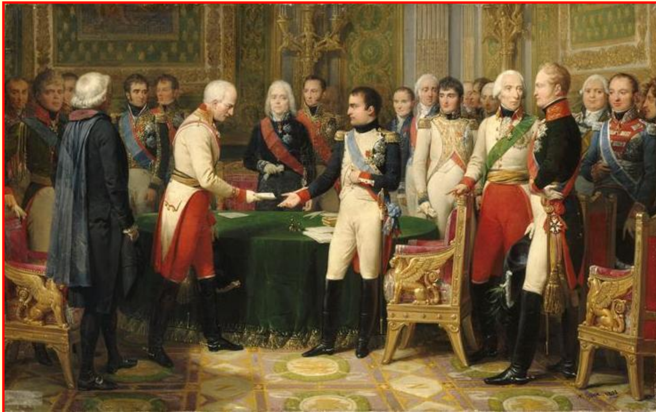
Встреча Наполеона и Александра I в Эрфурте

Противоречия между Францией и Россией сохранялись и обострялись. В 1808 г. произошла новая встреча Наполеона и Александра I в Эрфурте. Не смотря на демонстрацию дружеских отношений, Александр отказал Наполеону в помощи против Австрии. Обострение отношений вело к войне.