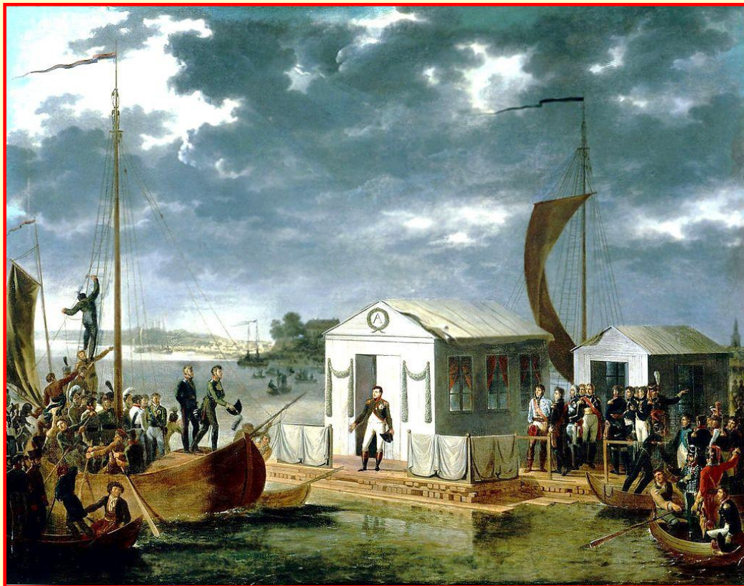
Встреча Наполеона и Александра I на реке Неман

25 июня 1807 г. состоялась встреча Наполеона и Александра I на реке Неман. После двух недель переговоров был подписан мирный договор. Россия признавала все завоевания Франции, присоединялась к континентальной блокаде и становилась военным союзником Франции.