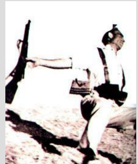
Р.Капа Пал в бою