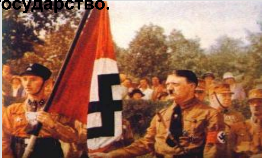
Гитлер и штурмовики

Экономический кризис 1929-1932гг. особенно сильно ударил по Германии: была парализована внешняя торговля, страна лишилась кредитов, спад производства составил 40%, в кризисе находилась банковская система, к 1932г. число безработных составило 8 млн. человек. В этих условиях резко возросло влияние фашистской партии НСДАП, а также коммунистов и социал-демократов. Однако последние недооценили опасность фашизма и не смогли договориться о совместных действиях, это обеспечило приход к власти Адольфа Гитлера. В 1933г. Гитлер был назначен рейхсканцлером (главой правительства). В Германии начинается новое государство.