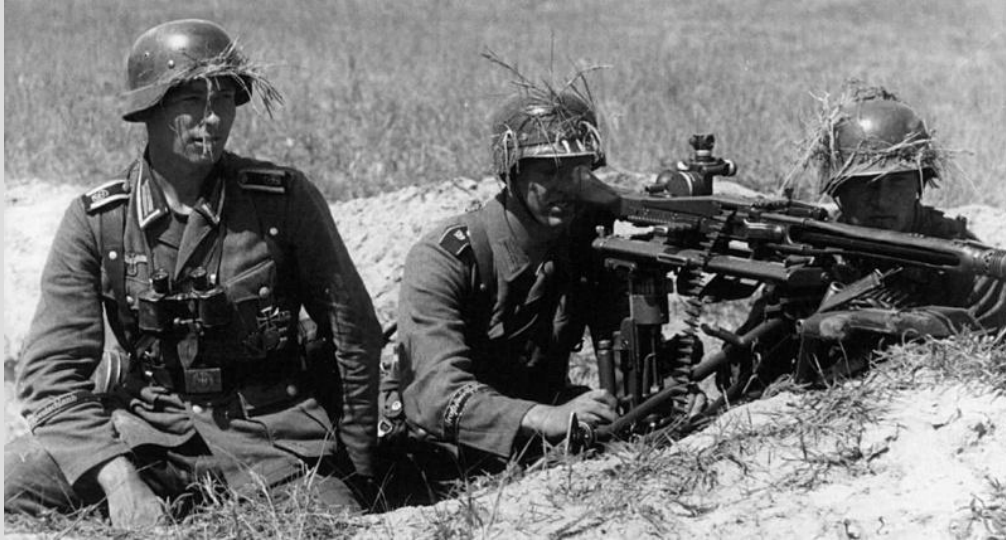
Пулемётчики вермахта «Великая германия»

Государство установило полный контроль над экономикой, регулировало производство продукции, цены, количество нанимаемых работников, уровень зарплаты, продолжительность рабочего дня, вводились общественные работы, изымалась часть прибыли предпринимателей, были запрещены профсоюзы на предприятиях и забастовки.