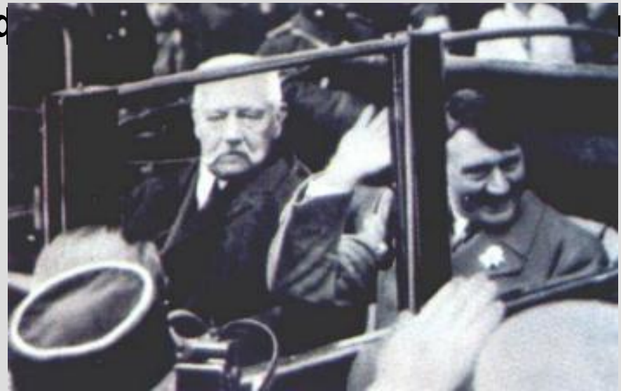
Президент Гинденбург и рейхсканцлер Гитлер