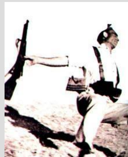
Р.Капа Пал в бою