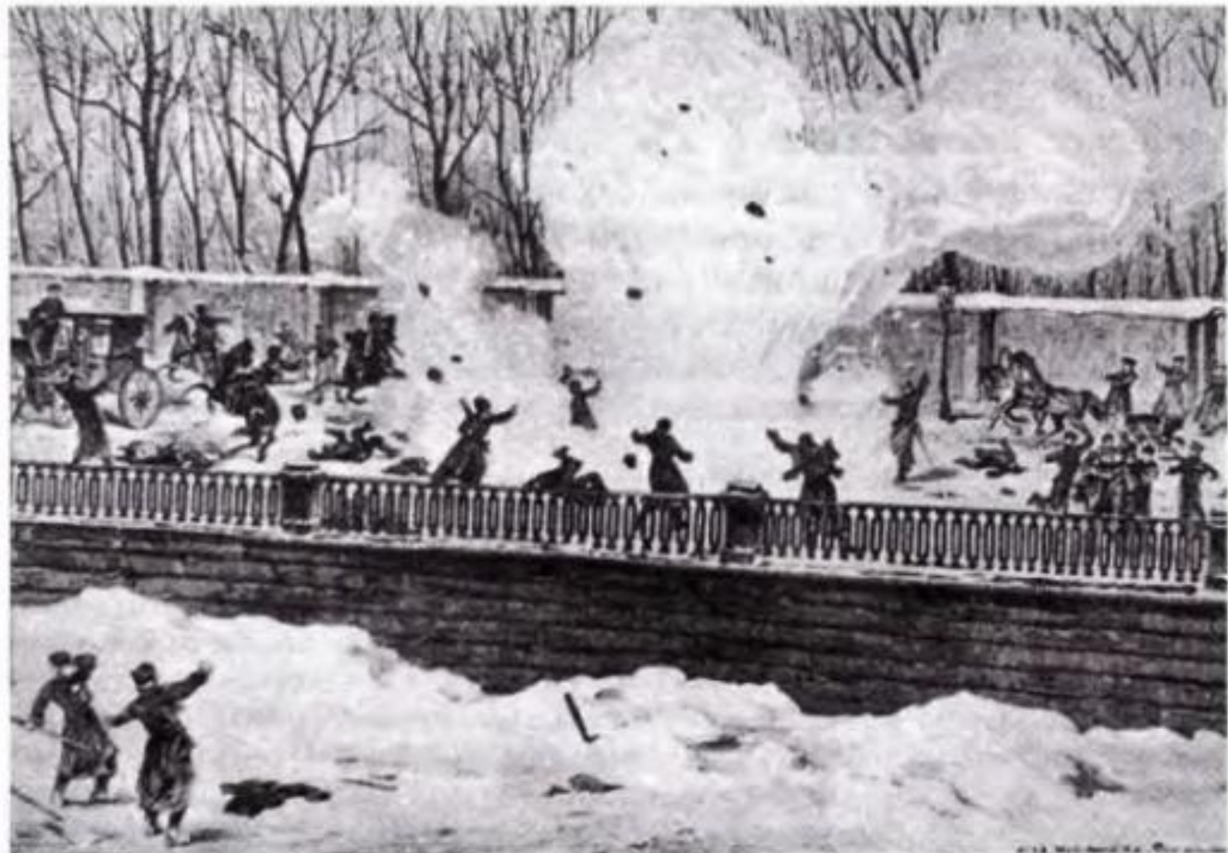
Покушение на Александра II 1 марта 1881 г.