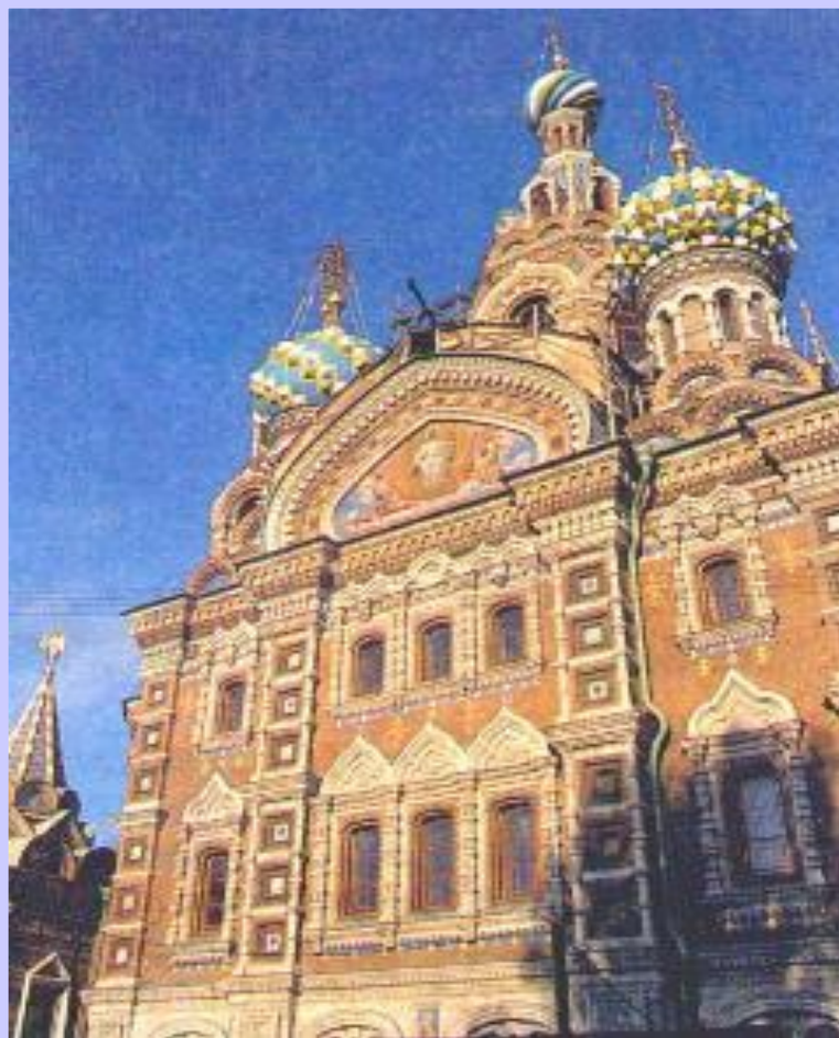
Храм Воскресения Христа на крови на месте убийст- ва Александра II.

На месте убийства Александра II в 1883-1907 гг. по проекту А.А.Парланда и И.В.Малышева был возведен собор Воскресения Христова, называемый также храмом Спаса-на-Крови. Здание построено в духе "узорочной" русской архитектуры XVI-XVII веков, его силуэт напоминает московский Покровский собор (храм Василия Блаженного). Под сводами храма Спаса-на-Крови - камни, на которые пролилась кровь царя.