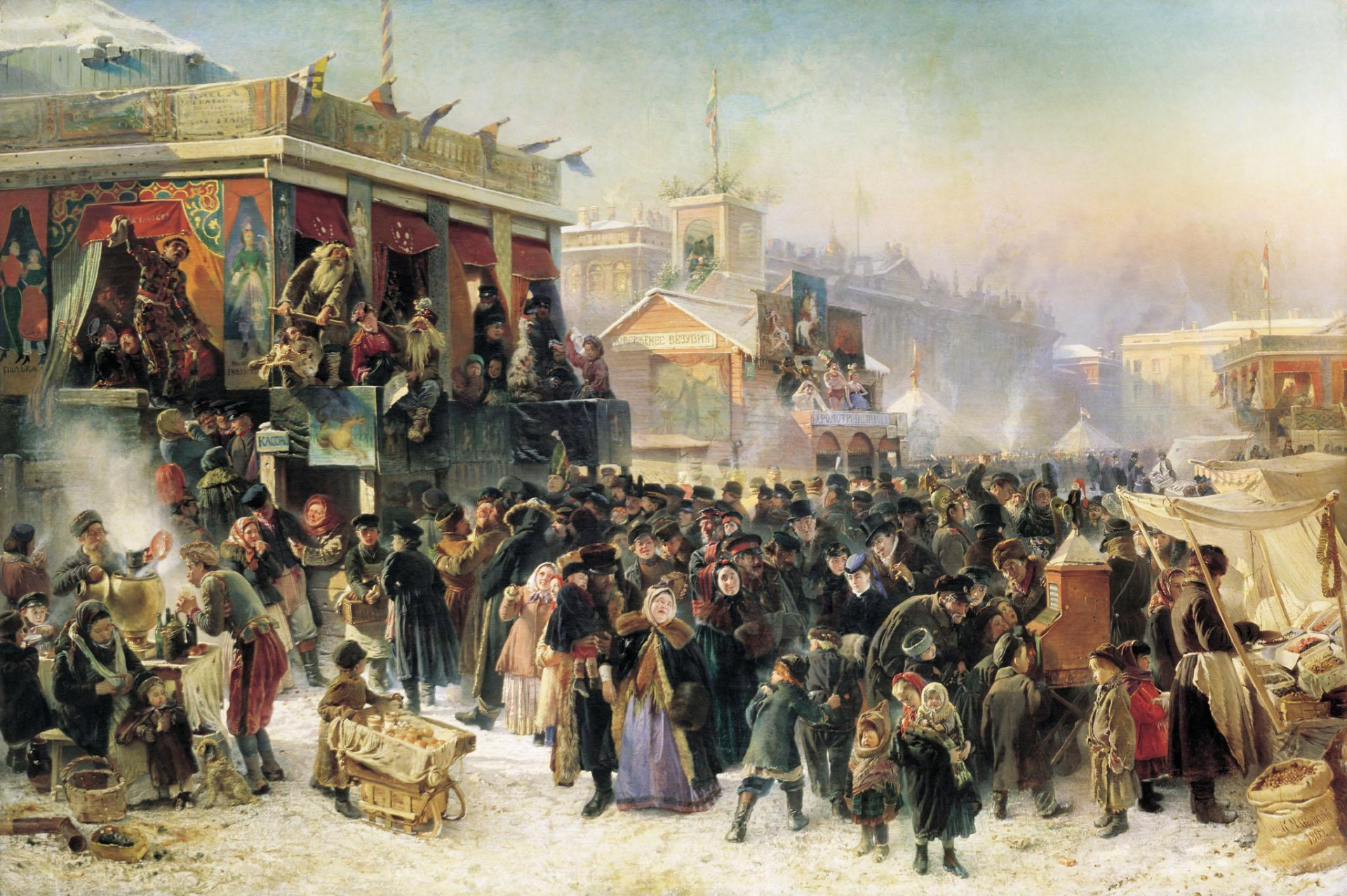
К.Е.Маковский Народное гуляние во время Масленицы на Адмиралтейской площади в Петербурге. 1923-1924.