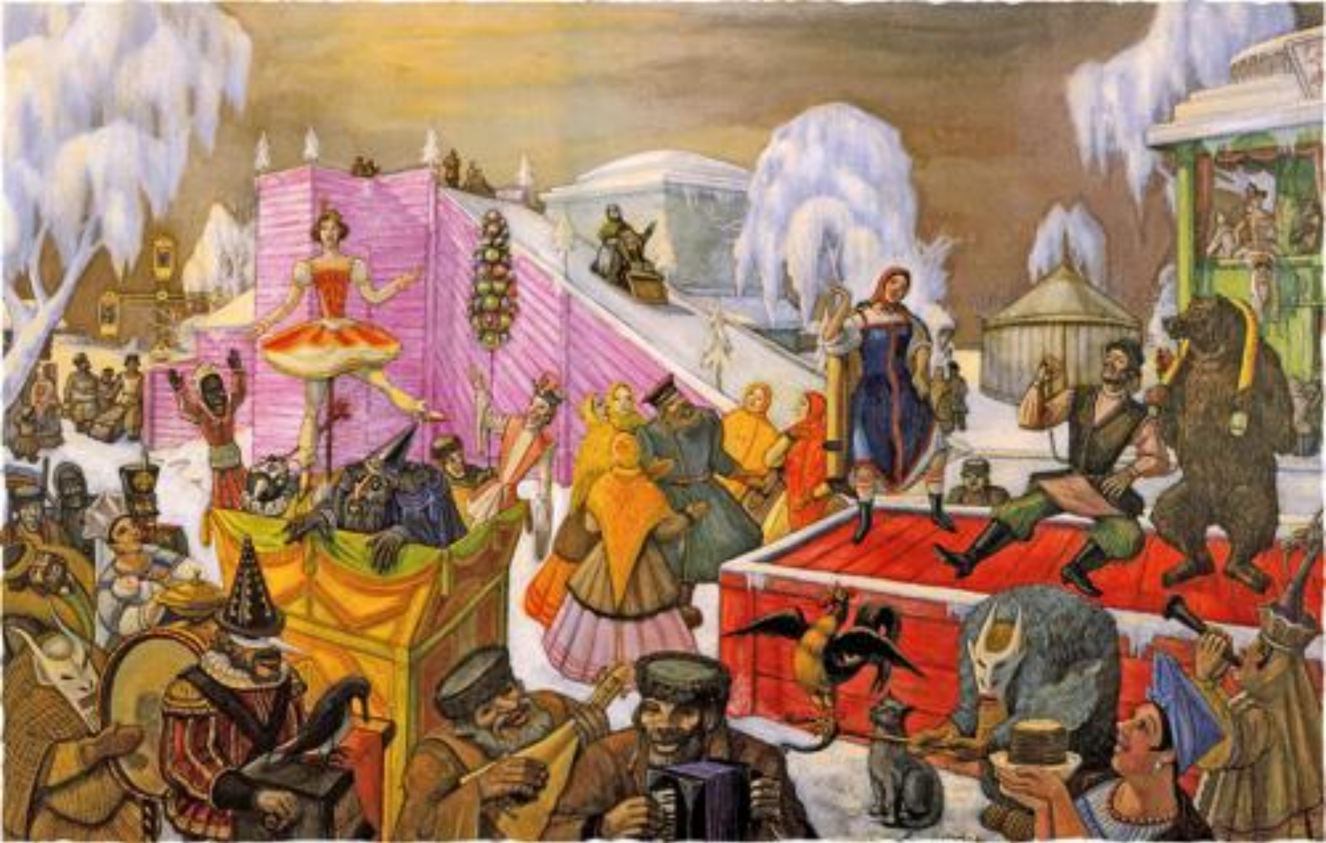
С.Судейкин. Масленица. 1923-1924