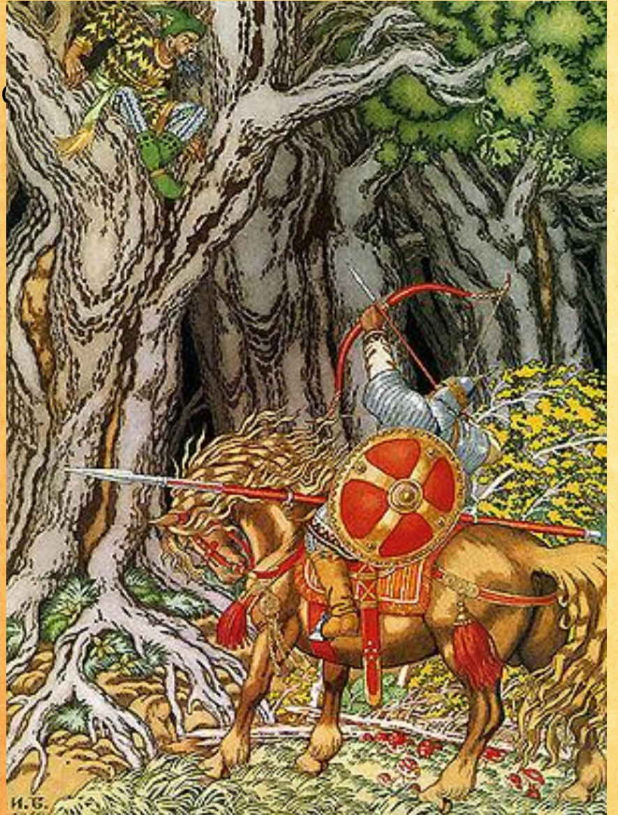
• И.Я. Билибин. Илья Муромец и Святогор