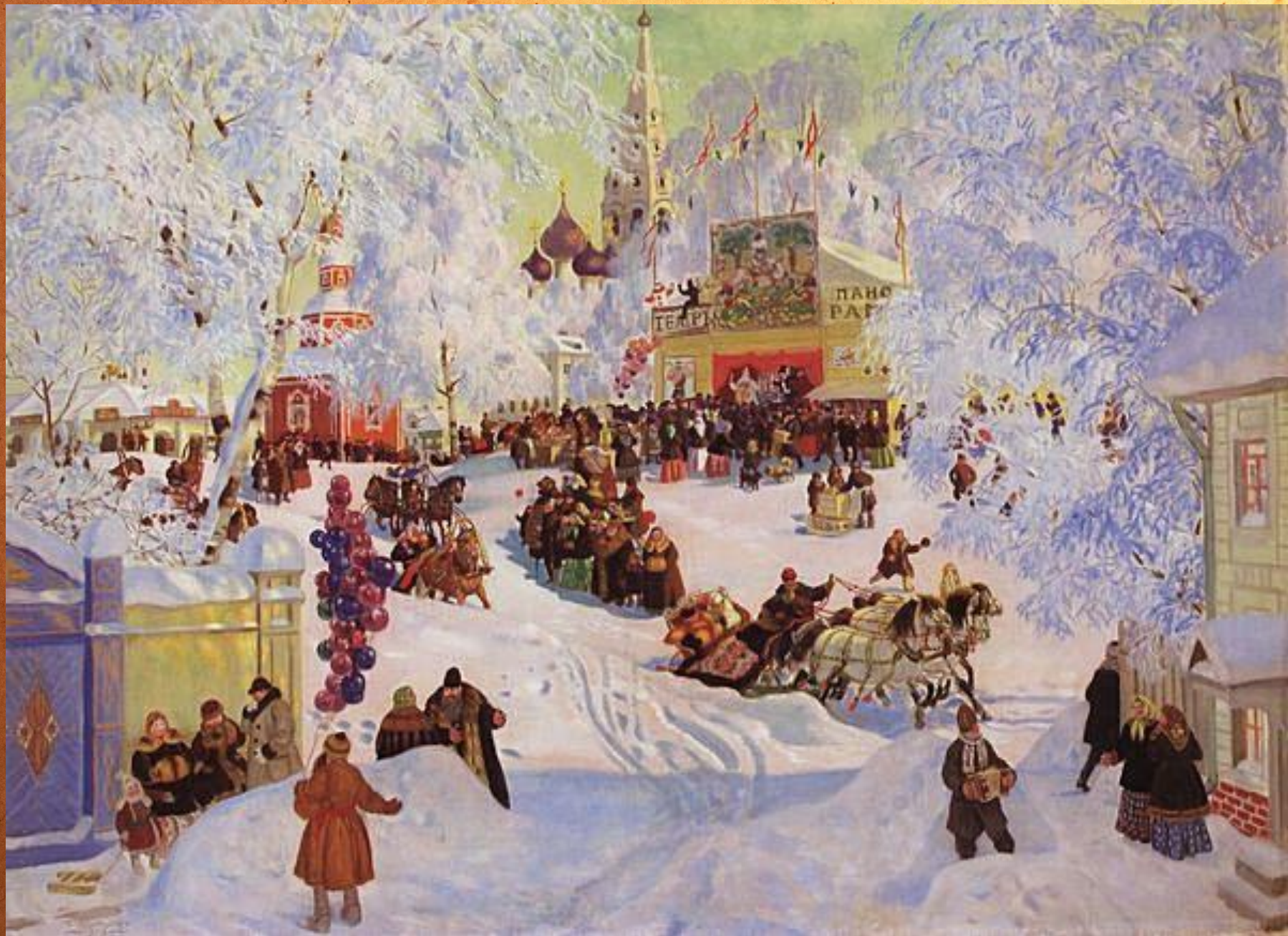
Борис Михайлович Кустодиев. Гулянья на Масленицу.