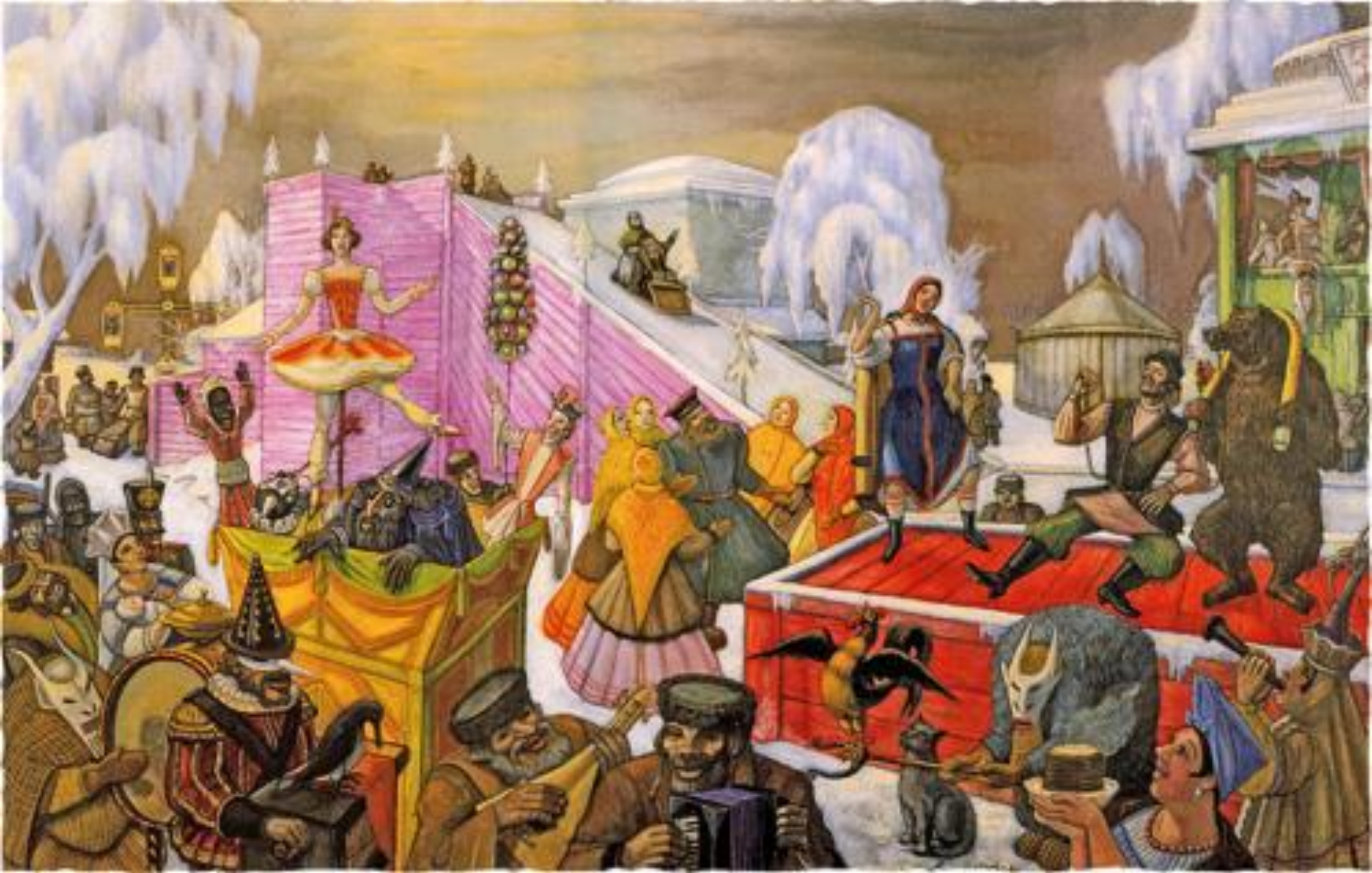
С.Судейкин. Масленица. 1923-1924