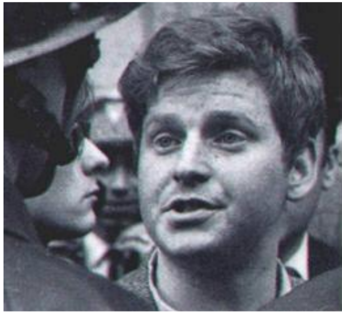
Руководитель студенческого движения Д.Кон-Бендит

Жестокость полиции увеличила ряды движения. Во Франции началась Всеобщая забастовка проходившая под социалистическими лозунгами.