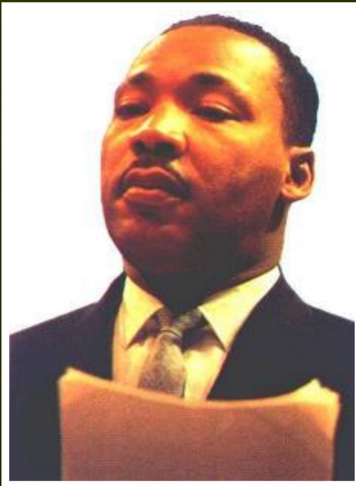
Мартин Лютер Кинг

В 1964 г. Кинг получил Нобелевскую премию Мира, но в 1968 г. Был застрелен расистом. Под воздействием негритянского движения в 1964 г. Л.Джонсон подписал закон о гражданских правах, но экстремисты продолжили борьбу вылившуюся в кровавые столкновения. Расовый кризис удалось преодолеть лишь к н.70-х гг.