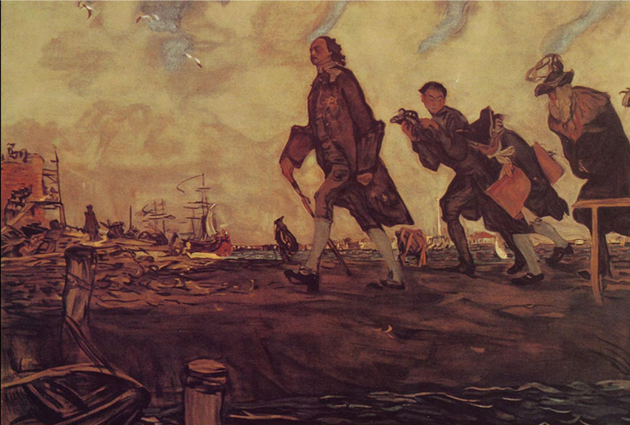
Петр Великий Художник В. А. Серов