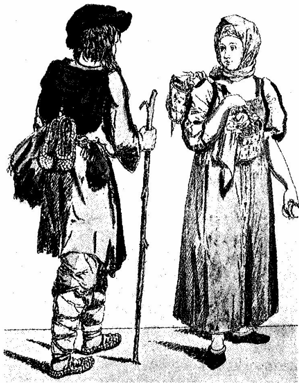
К. А. Зеленцов. Крестьянин и крестьянка. Офорт. XVIII в.

Рост мануфактур привел к увеличению числа работных людей. Условия труда были тяжелыми. Работные люди протестовали против таких условий работы.