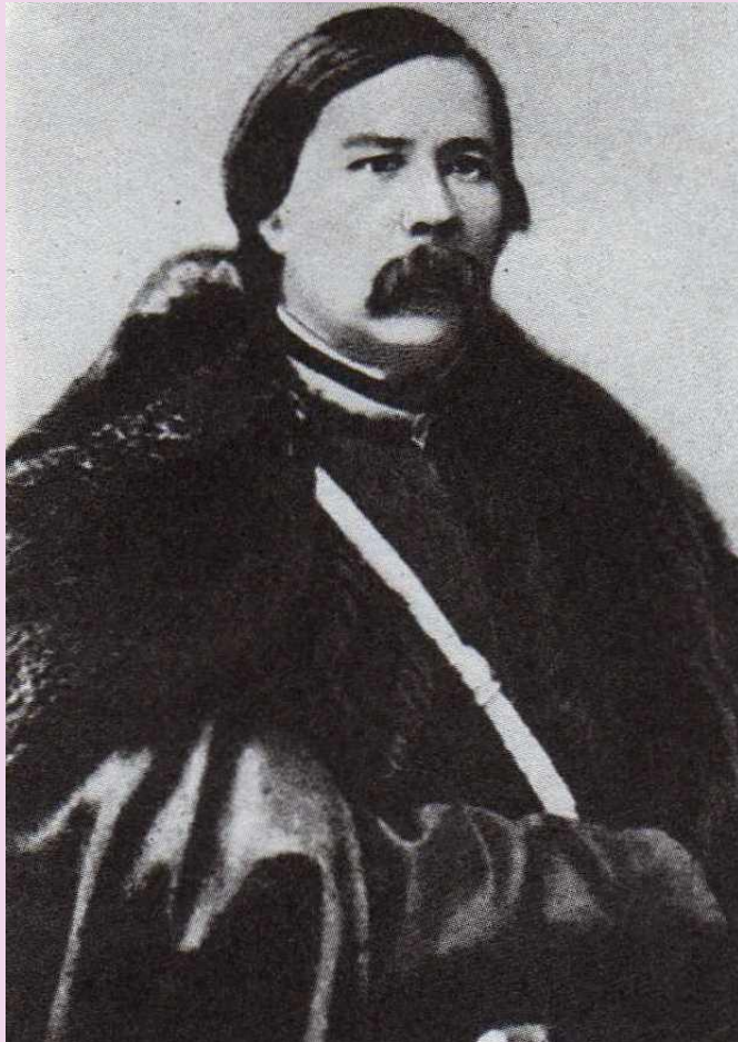
ФОТО НАЧАЛА 1860-Х ГГ.