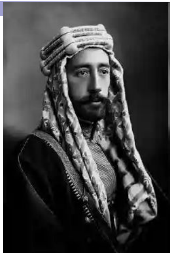
Коронация Фейсала королём Ирака, 1921 год