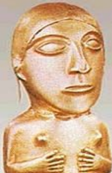
Статуя из золота