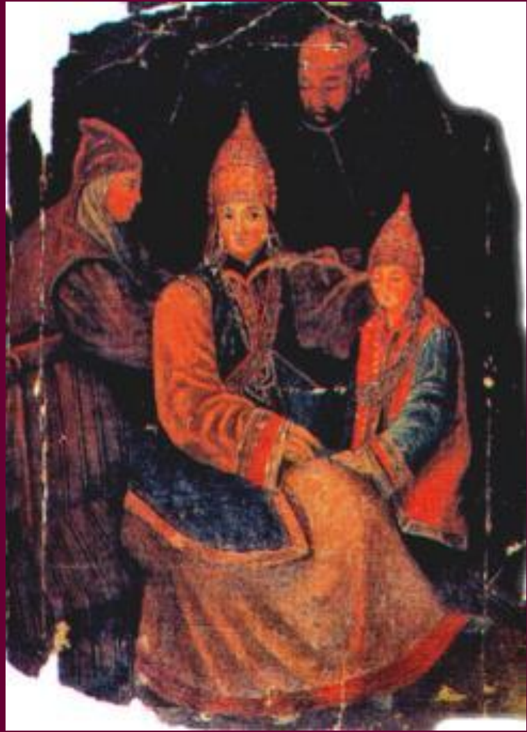
Жена последнего Казанского хана Саюмбека в русском плену.

Другим направлением политики царя в Поволжье стало создание многочисленного слоя русского населения. Служилые люди получали здесь земли, но в начале вынуждены были селиться под защитой крепостных стен. В начале были розданы земли ханов, а затем - ясачного населения. Широкое развитие получило монастырское землевладение. государство помогало переселенцам и устанавливало для них льготы.