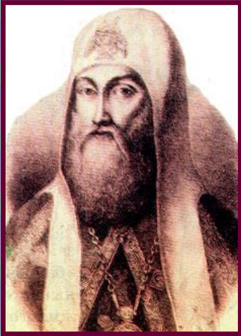
Митрополит Казанский Гермоген.

В 1589 г. Казанскую епархию возглавил митрополит Гермоген. Он заявил что христианство не получило поддержки местного населения и призвал перейти к насильственным мерам. Всех крестившихся должны были поселить отдельно от мусульман и следить за отправлением ими культа. Одновременно этим людям были даны экономические льготы, прежде всего в земельном вопросе.