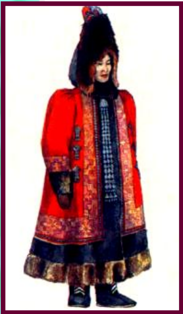
Якутская женщина в зимнем национальном костюме.

У Байкала жили буряты, разводившие крупный рогатый скот и занимавшиеся земледелием. Просо, гречиху и ячмень они обменивали у тунгусов на пушнину. В 17 в. у бурятов зарождается знать.