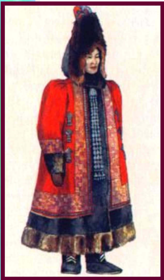
Якутская женщина в зимнем национальном костюме.

У Байкала жили буряты, разводившие крупный рогатый скот и занимавшиеся земледелием. Просо, гречиху и ячмень они обменивали у тунгусов на пушнину. В 17 в. у бурятов зарождается знать.