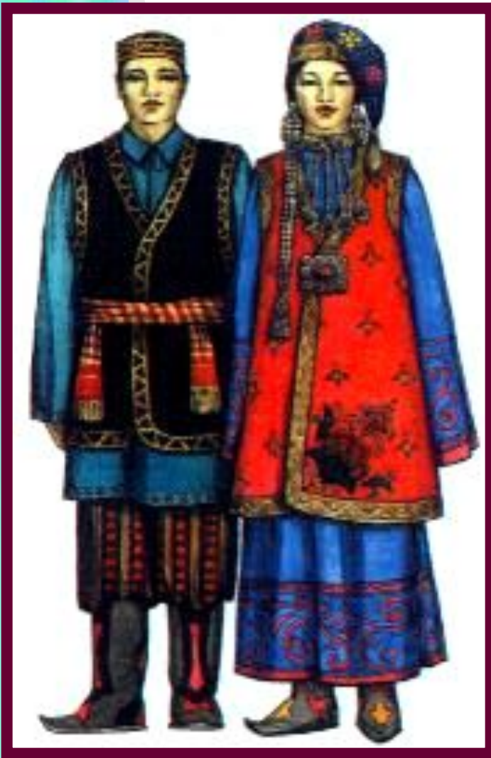
Татарский национальный костюм.

Покорение Поволжья и Приуралья завершилось в 17 в. Здесь возникли города (Уфа, Самара), прикрывавшие центр от набегов кочевников.