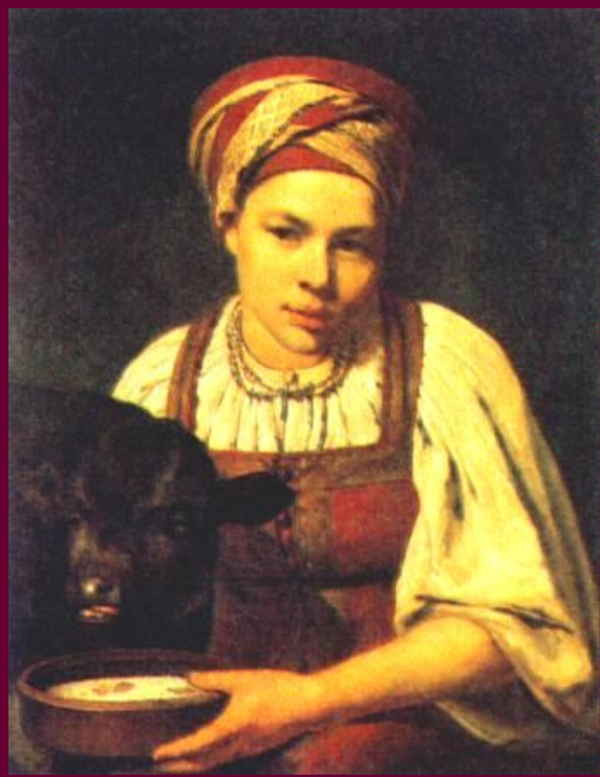
А.Венецианов.Крестьянская девушка с телянком.

Население России к к.18 в.до- стигло 37 млн.человек.51% населения составляли не- русские народы.В ряде слу- чаев они имели большие права,чем русский народ (На Украине до 1783 г.не было крепостничества.)