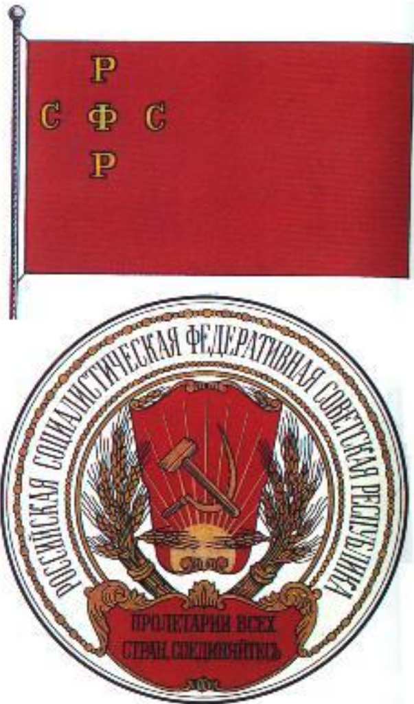
Флаг и герб РСФСР.

Гряд национальных окраин вошел в состав РСФСР на правах автономий. 1 ноября советская власть победила в Туркестане. В к.ноября в Коканде было провозглашено мест-ное национальное прави-тельство, но вскоре оно было ликвидировано красногвардейцами и Ту ркестан вошел в состав РСФСР. Недовольные этим начали басмачес-кое движение. Весной 18 г.в составе РСФСР были созданы Татаро-Башкир ская и Кубано-Черномор ская автономные респу-блики.