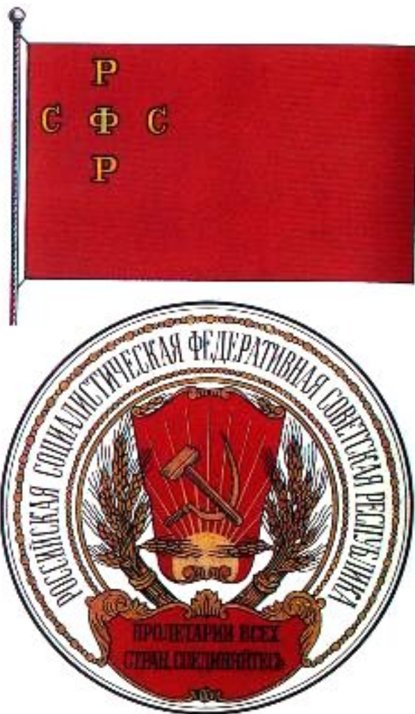
Флаг и герб РСФСР.

Гряд национальных окраин вошел в состав РСФСР на правах автономий. 1 ноября советская власть победила в Туркестане. В к.ноября в Коканде было провозглашено мест-ное национальное прави-тельство, но вскоре оно было ликвидировано красногвардейцами и Ту ркестан вошел в состав РСФСР. Недовольные этим начали басмачес-кое движение. Весной 18 г.в составе РСФСР были созданы Татаро-Башкир ская и Кубано-Черномор ская автономные респу-блики.