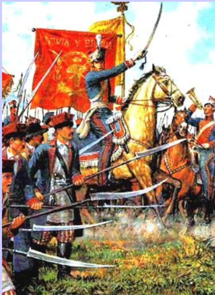
Восставшие на марше

После принятия Конституции 1815 г. поляки ожидали предоставления им независимости, но в н.20-х гг. император Константин начал проводить насильственную русификацию. В 1830 г. в Польше вспыхнуло восстание. Его поводом стала попытка послать поляков на подавление революции во Франции. Поляки попытались убить Константина и захватили арсенал