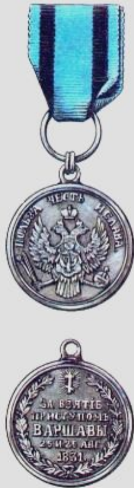
Памятная медаль «За взятие Варшавы»

13.1.1830 Сейм объявил о лишении Николая I права на польский престол.