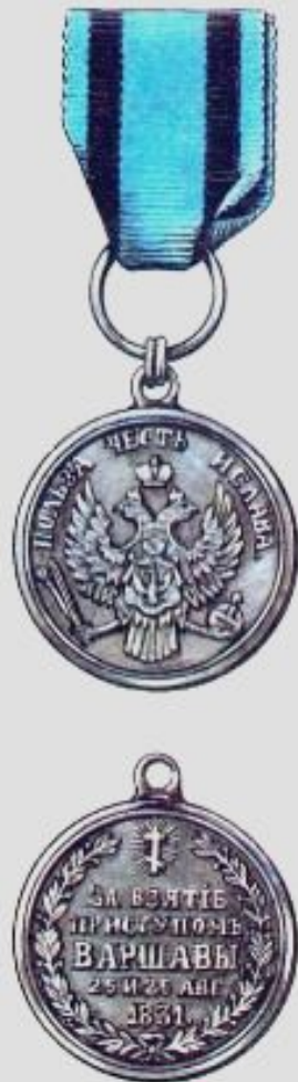
Памятная медаль «За взятие Варшавы»

13.1.1830 Сейм объявил о лишении Николая I права на польский престол.