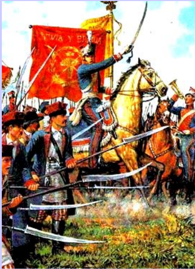
Восставшие на марше

После принятия Конституции 1815 г. поляки ожидали предоставления им независимости, но в н.20-х гг. цесаревич Константин начал проводить насильственную русификацию. В 1830 г. в Польше вспыхнуло восстание. Его поводом стала попытка послать поляков на подавление революции во Франции. Поляки попытались убить Константина и захватили арсенал