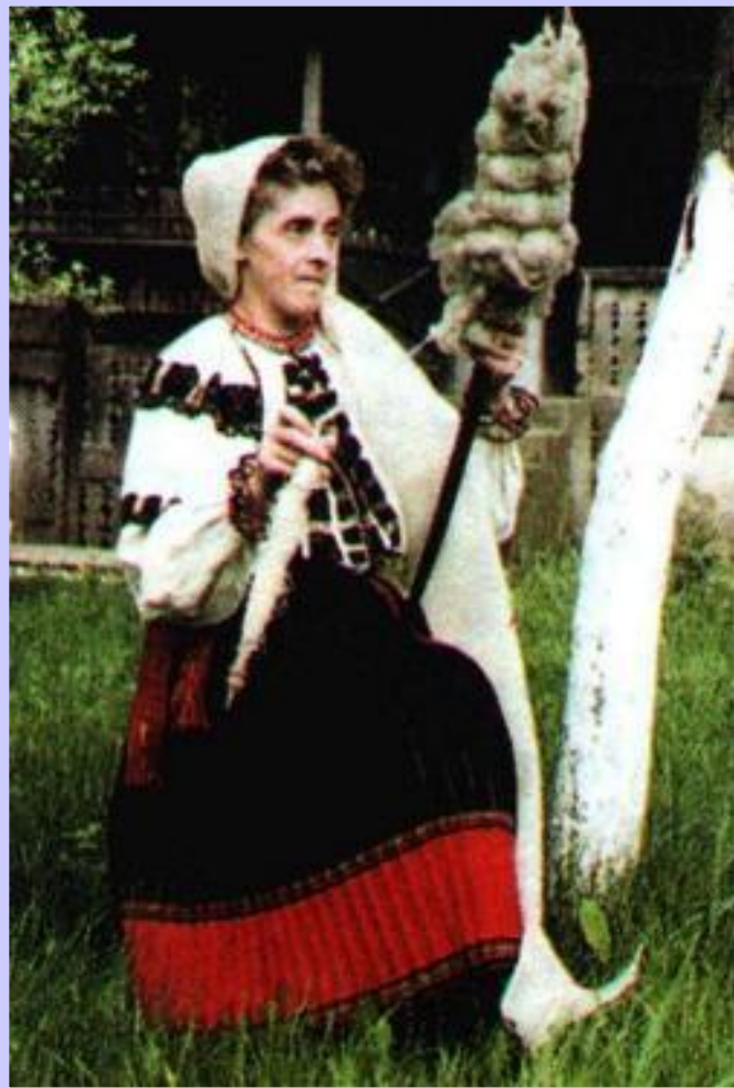
Молдавский народный Костюм.

Бессарабия вошла в состав России в 1812 г. С 1817 г. здесь возникают казачьи поселения. В 1828 г. Николай I, ограничил местную автономию, но местным феодалам дали права российского дворянства.