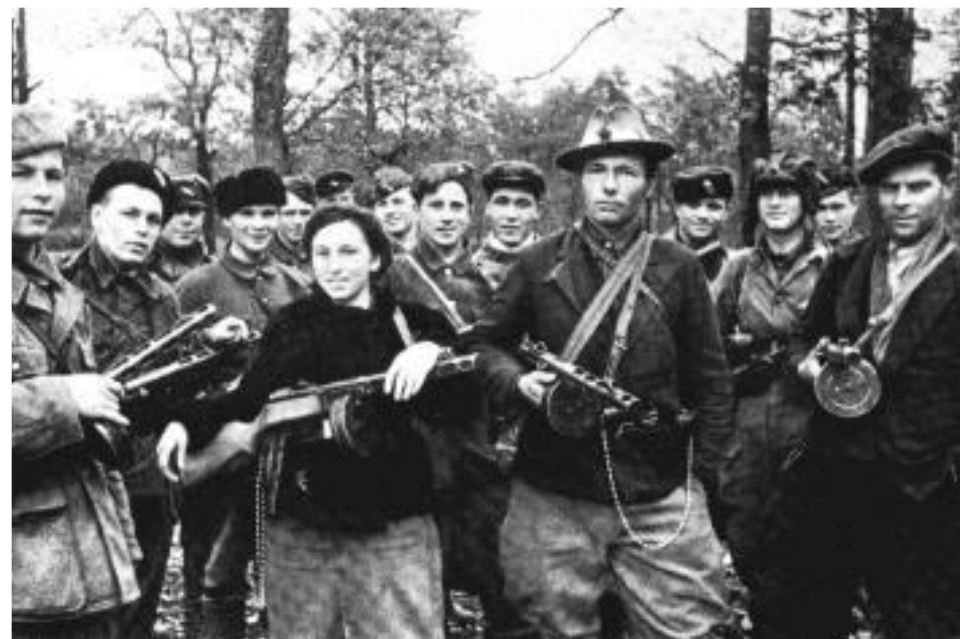
Партизанский отряд в Приднестровье. Апрель 1943 г.

Дружба людей разных национальностей помогла при защите Москвы, Ленинграда, Севастополя и т.д. Среди 11 тысяч героев СССР (в годы войны), были представители почти всех народов нашей страны.