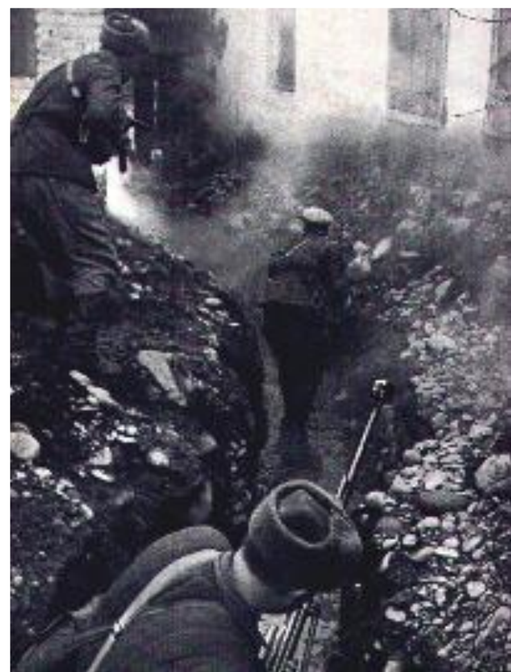
Бой за Моздок. Сентябрь 1942 г.

Начиная войну Гитлер рассчитывал, что СССР развалится как «карточный домик», но советский народ наоборот только сплотился.