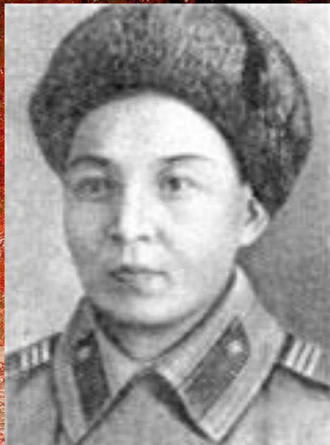
Мамётова Маншук пулемётчица 21-й гвардейской стрелковой дивизии 3-й ударной армии Калининского фронта, гвардии старший сержант. Первая казахская женщина, которой было присвоено звание Герой Советского Союза.