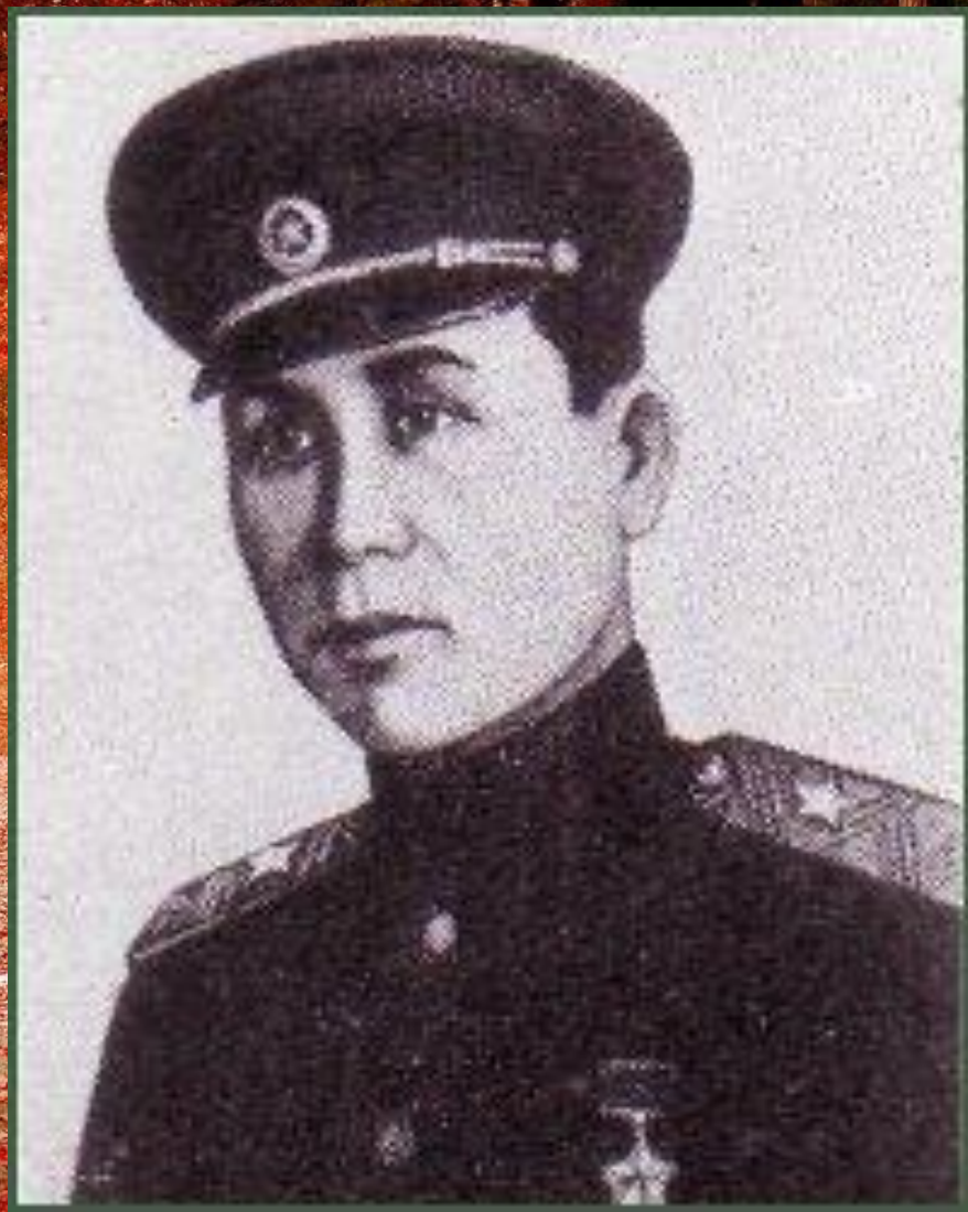
Гвардии генерал-майор, Герой Советского Союза Сабир Рахимов, командующий армией Белорусского фронта.