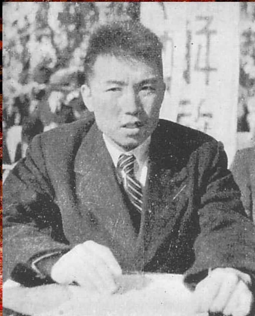
Ким Ир Сен, майор, командир батальона 88-ой отдельной стрелковой бригады. В будущем президент Северной Кореи.