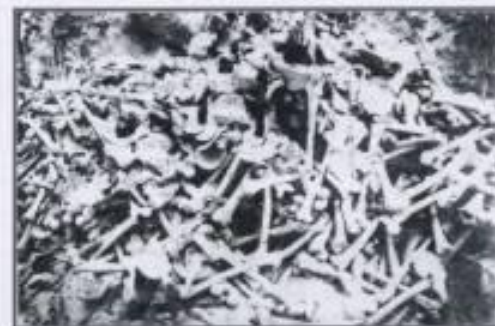
Фото 15 – ОСТРОВКИ (OSTROWKI) и ВОЛА ОСТРОВИЦКА (WOLA OSTROWIECKA), уезд Люблин, повстанчество 1942-1943

Результат проведенной 17 – 22 августа 1942 года массовой расчистки полянков, расположенных в районе Островки и Воля Островицка, совершённой террористами ОУН – УПА (OUN – UPA). Украинские источники из Киева с 1944 года сообщают об общей количестве жертв в двух перечисленных селах 2 000 человек.