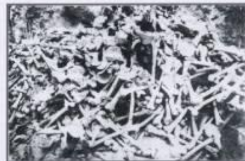
Фото 34 – ОСТРОВКИ (OSTROWKI) и ВОЛА ОСТРОВИЦКА (WOLA OSTROWIECKA), село Лобовик, количество трупов Август 1992

Результат проведенной 17 – 22 августа 1992 года эксгумации жертв массовой резни поляков, произошедшей в районе Островки и Воля Островицка, совершённой террористами ОУН – УПА (OUN – UPA). Украинские источники из Киева с 1988 года сообщают об общей количестве жертв в двух перечисленных селах 2 000 поляков.