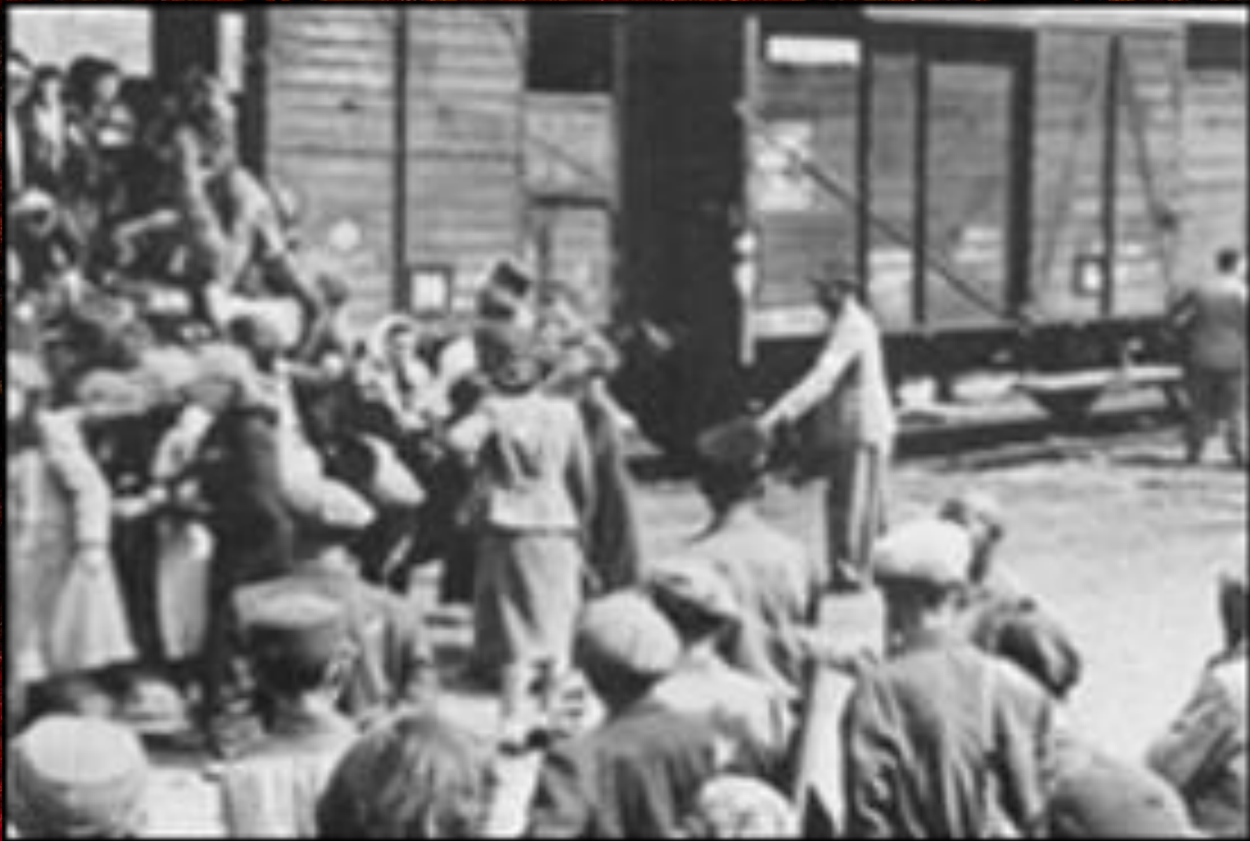
Депортация чеченцев и ингушей.