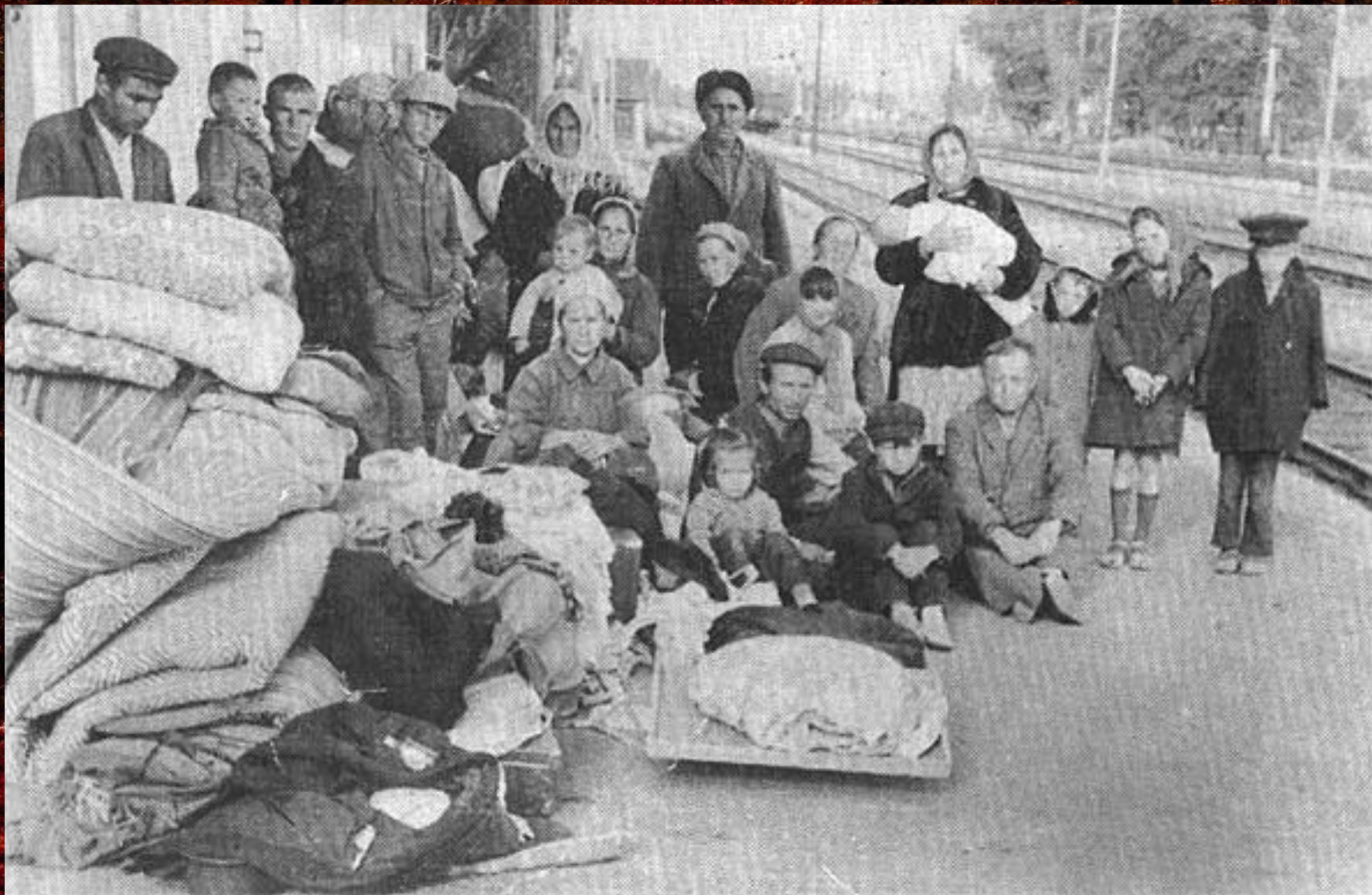
В ожидании депортации. Крымские татары.