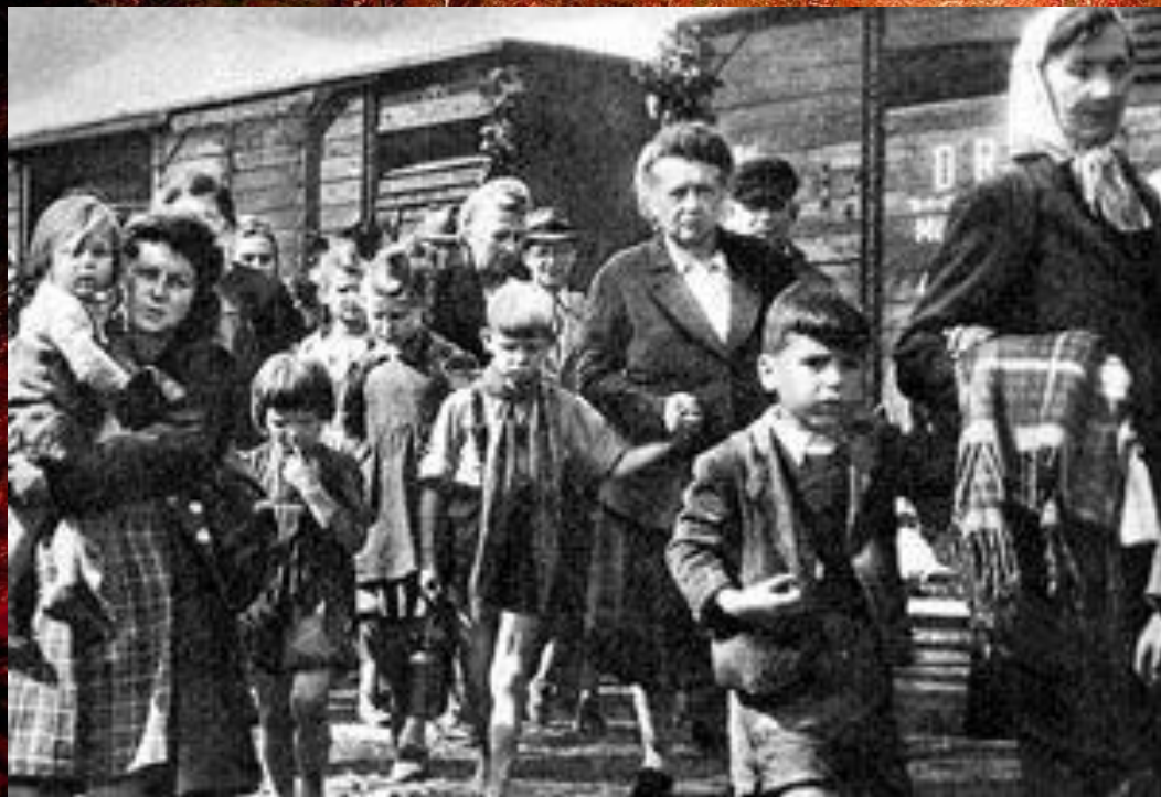
Ожидание депортации. Немцы Поволжья на станции.

Активизация национальных движений привела к ужесточению национальной политики. Летом 1941 г. «диверсантами и шпионами» объявили немцев Поволжья.(1,5 млн. чел.) и выслали в Сибирь и Казахстан. Тогда же по тому же обвинению депортировали в Сибирь 50 тыс. литовцев, латышей, эстонцев. В октябре 1943 г. в Казахстан и Киргизию выселили 70 тыс. карачаевцев, а в Сибирь 93 тыс. калмыков, 40 тыс. балкарцев. Многих снимали прямо с фронта несмотря на посты и звания и также депортировали. 23 февраля 1944 г. на Восток отправили 650 тыс. чеченцев и ингушей, а в мае 1944 г. в Узбекистан отправили 180 тыс. крымских татар. В результате депортации десятки тысяч погибли в пути.