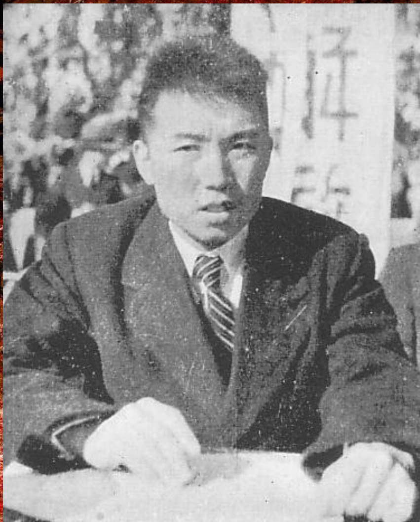
Ким Ир Сен, майор, командир батальона 88-ой отдельной стрелковой бригады. В будущем президент Северной Кореи.