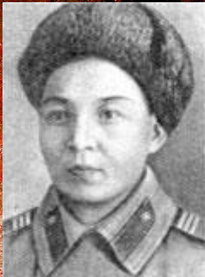
Мамётова Маншук пулемётчица 21-й гвардейской стрелковой дивизии 3-й ударной армии Калининского фронта, гвардии старший сержант. Первая казахская женщина, которой было присвоено звание Герой Советского Союза.