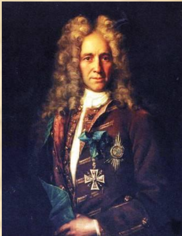
И.Н.Никитин. Портрет канцлера графа Г.И. Головкина. 1720-е