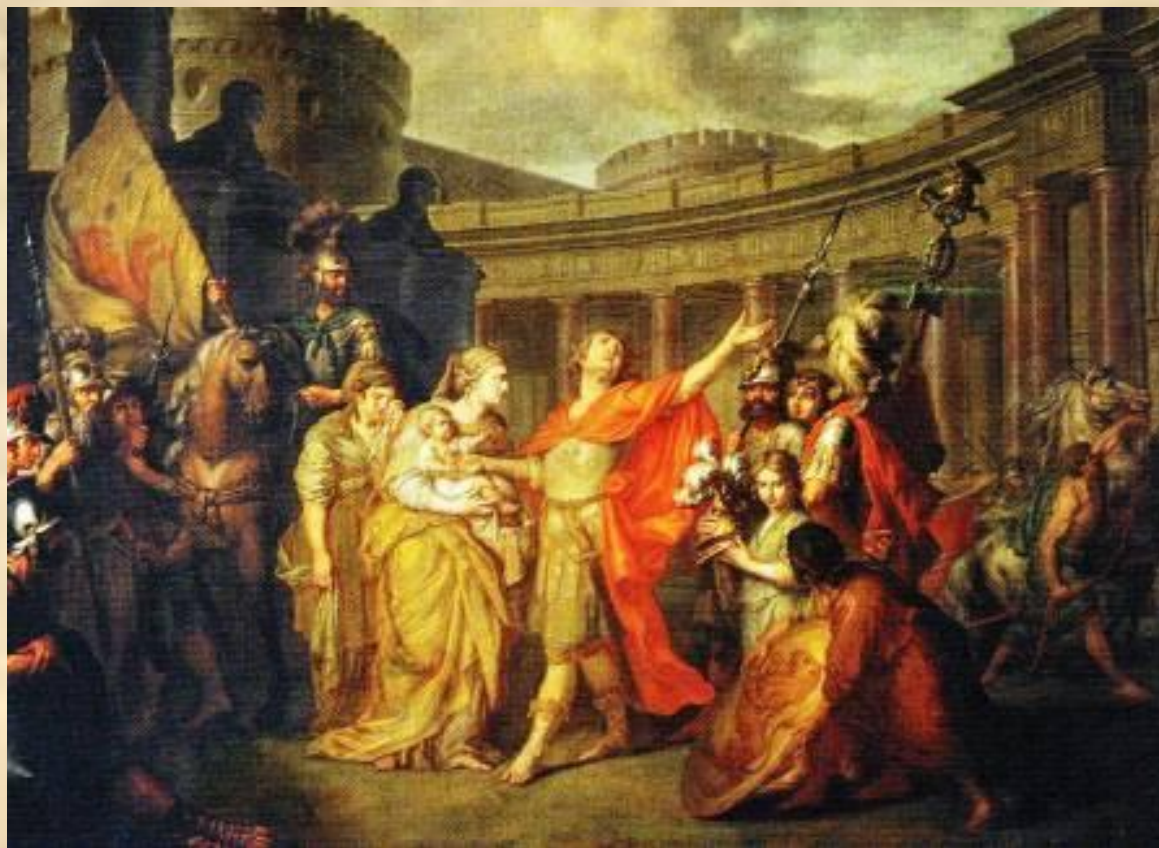
А.П.Лосенко. Прощание Гектора с Андромахой. 1773