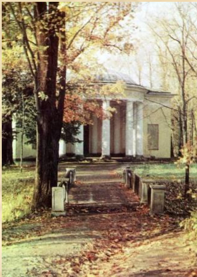
г.Пушкин. Павильон Концертный зал.