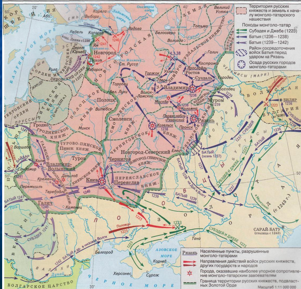
МОНГОЛО-ТАТАРСКОЕ НАШЕСТВИЕ НА РУСЬ. 1223—1242 гг.