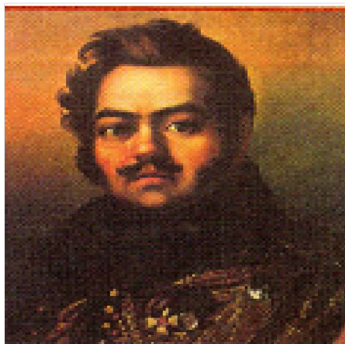
ДОБЛЕСТНЫЙ РУССКИЙ ГЕНЕРАЛ Д.И. ДАВЫДОВ