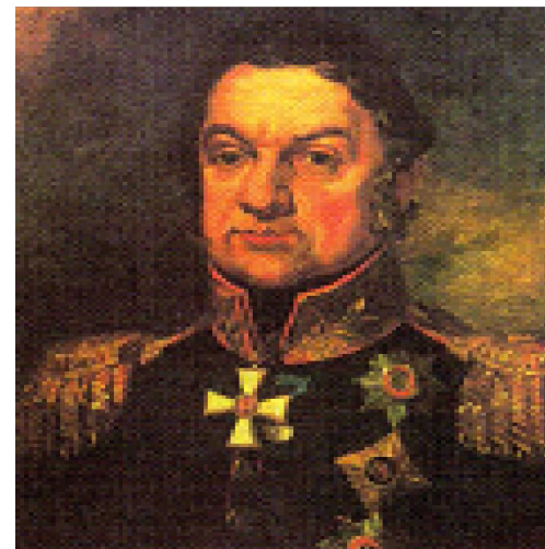
РУССКИЙ ГЕНЕРАЛ Д.С. ДОХТУРОВ