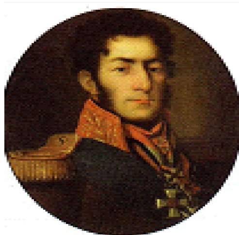
ГЕНЕРАЛ КНЯЗЬ П.И. БАГРАТИОН