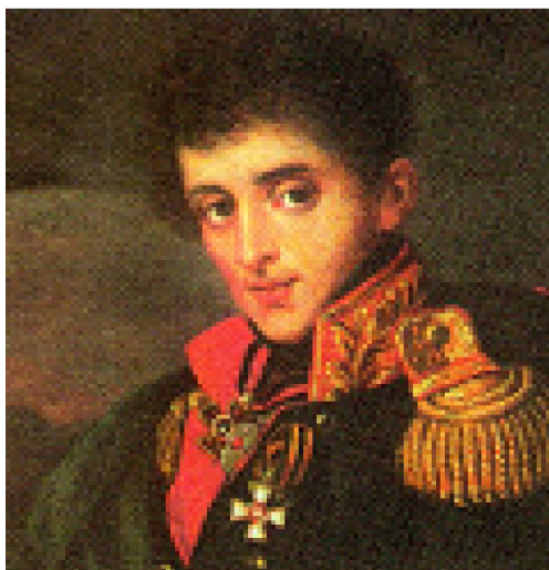
А.А. ТУЧКОВ РУССКИЙ ГЕНЕРАЛ