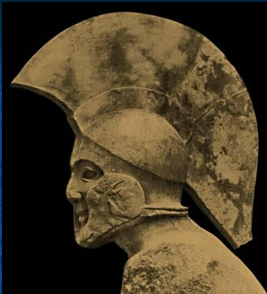
Спартанский царь Леонид