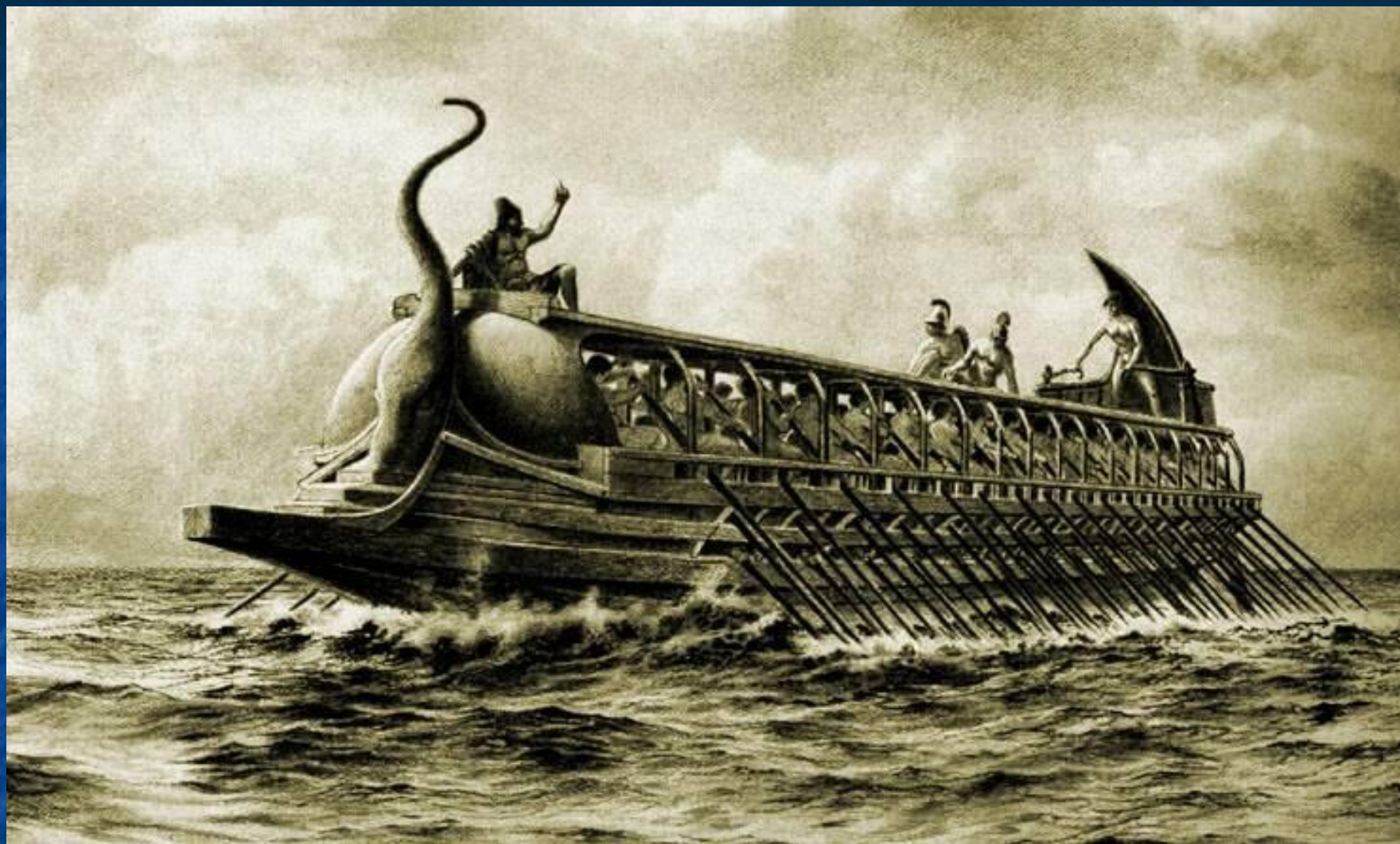
Персидский военный корабль