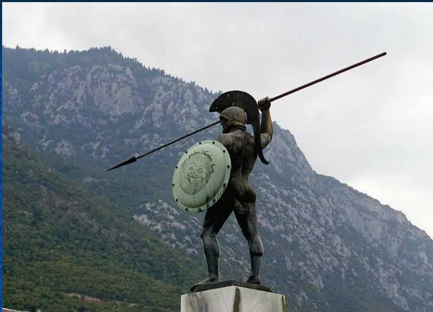
Монумент в честь защитников Фермопил